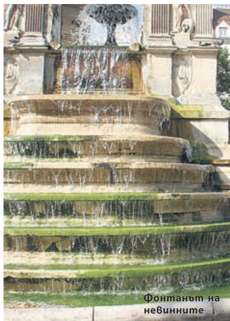
Фонтанът на невинните

Фонтан Ди Треви в Рим бълбука още от 1762 г. и е една от най-големите за- бележителности в града. Водата му е изключително чиста. В центъра на фон- тан Ди Треви е разположена статуя на бог Нептун, а от двете му страни има две женски фигури - Изобилие и Здраве. Първата излива вода, а втората е с ча- ша в ръка, от която пие змия. Около фонтана витаят много легенди, но най- популярната е, че ако хвърлиш монета