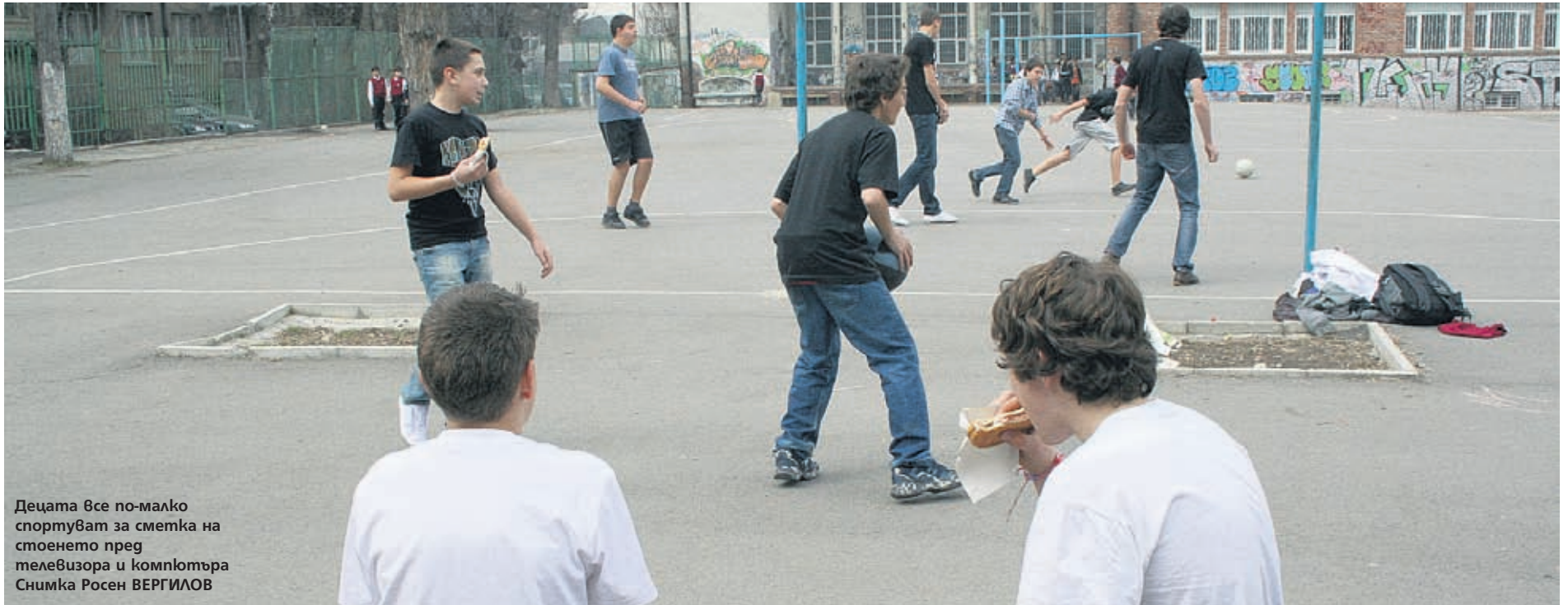
Деца все по-малко спортуват за сметка на стоенето пред телевизора и компютъра