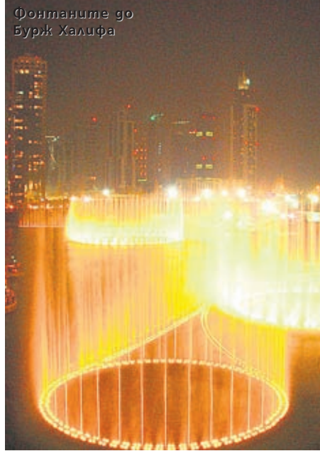
Фонтаните до Бурж Халифа