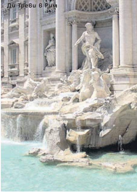
Ди Треви в Рим