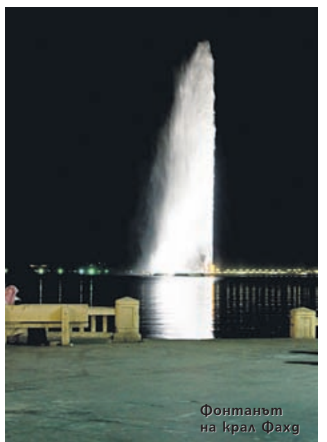
Фонтанът на крал Фахд

Фонтанът на крал Фахд се намира в град Джидда, Саудитска Арабия. Водната струя достига 312 м, което го поставя на първо място в света по височина. Всяка една от трите помпи на фонтана изстрелва водната струя със скорост 375 км/ч. Вечерно водата се оцветя- ва от 500 мощни прожектора в различ- ни цветове. (ЖЗ)