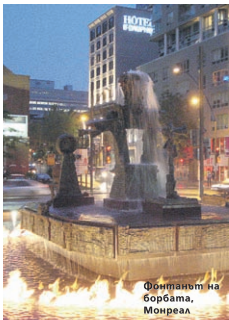
Фонтанът на борбата, Монреал

В средата на XVI век на едно от па- рижките гробища се появил Фонтанът на невинните - така се наричал самият църковен двор, където били погребвани бебета, бедни хора и душевноболни. След два века гробището било затворе- но и фонтанът преместен, но името му останало.