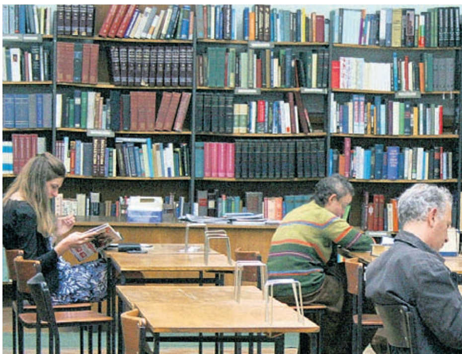
Библиотеките все още са средище на духовност и любознателност