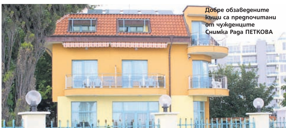
Добре обзаведените къщи са предпочитани от чужденците

Втората група руски граждани се насочва към вътрешността на страната, търсейки жилища на цени до 10 000-20 000 евро. Това са най-вече пенсионирани руснаци с ограничен бюджет. Те се ориентират предимно към селски къщи, даващи възможност