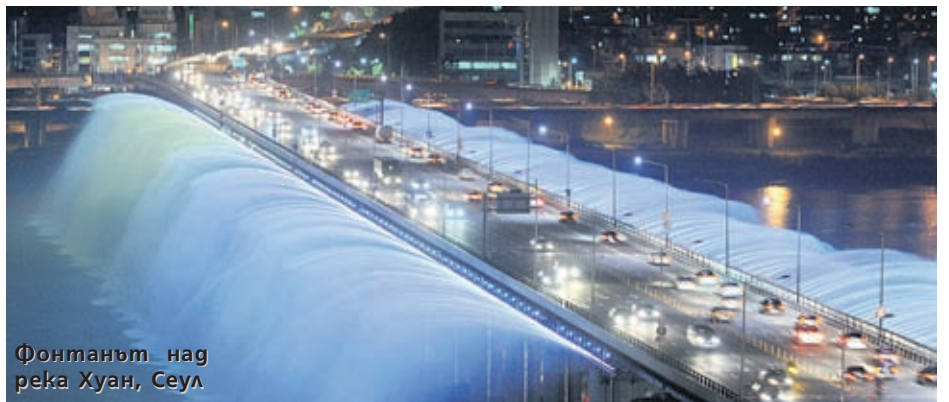
Фонтанът над река Хуан, Сеул

В Дубай, близо до най-високата сгра- да в света - небостъргача Бурж Халифа, от 2009 г. под звуците на музика танцу- ват водите на фонтан, за чието стро- ителство бяха похарчени 217 милиона долара. В началото на 2010 г. височина- та на водните струи беше увеличена до 275 метра. 6600 светлинни прожек- тора и 25 цветни лампи осветяват во- дите на фонтана, който може да бъде видян от 25 мили.