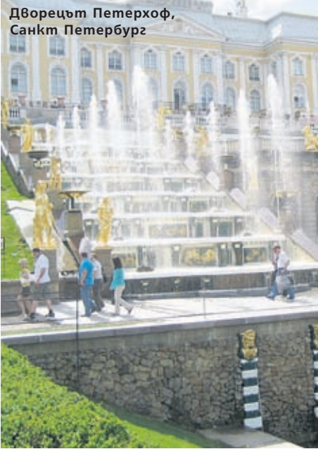
Дворецът Петерхоф, Санкт Петербург