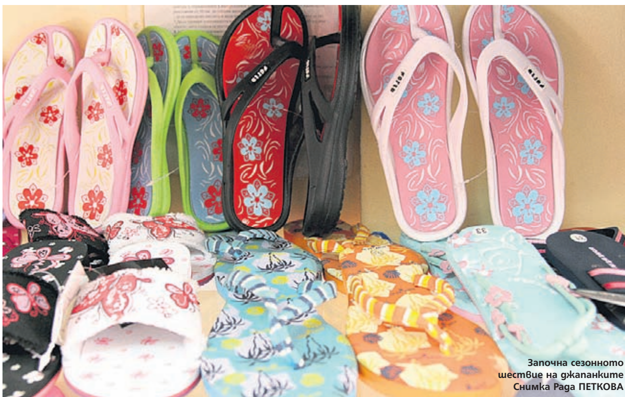
Започна сезонното шествие на джапанките

Звезди се разхождат в маркови джапанки без грам притеснение. Американски спортисти дори отидоха, обути с тях, при президент-