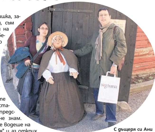
С дъщеря си Ани в най-старото шведско селище Сигтуна

- В началото изпитах страшно шубе от това кой, по дяволите, ще иска да гледа филм за бабички в някакво село. Но той се прие по-добре и от най-смелите ми очаквания. Мой приятел питал студентите си защо им харесва "Писмо до Америка" и те казаха - защото е първият български филм, който говори с любов за неща, от които иначе трябва да се срамуваме, и второ, не ни казва - "останете тук", а "където и да сте, бъдете си вие, защото носите стойностни неща". Сто процента вярвам, че когато има искрена емоционалност в един филм, публиката я долавя и се получава като в човешкото общуване. Като актьорите, които плачат - или истински се разплакват, или им се пуска глицерин. Не бих си позволила сцена с актьор, от когото искам да се разплаче, без да го