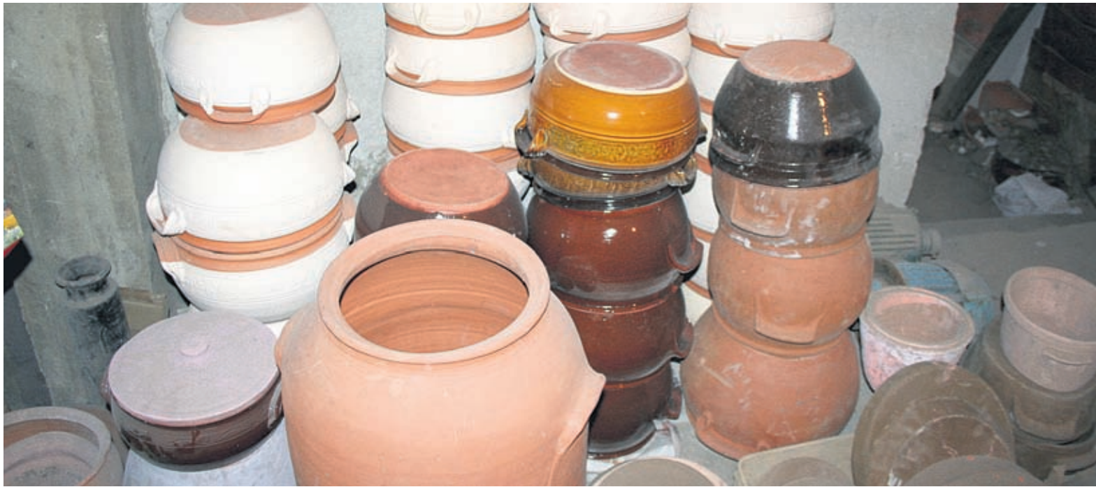
Вкусът на храната в калени съдове е уникален