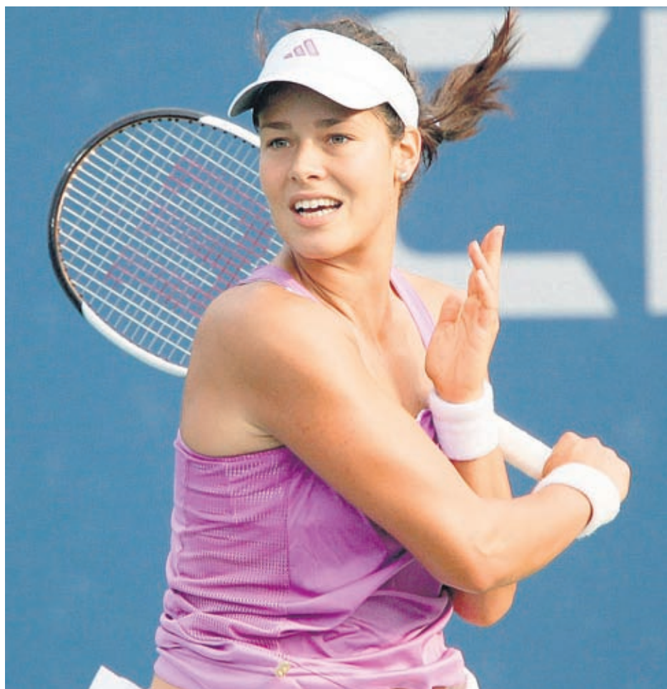
Ана Иванович грабна миналогодишния приз на Турнира на шампионките