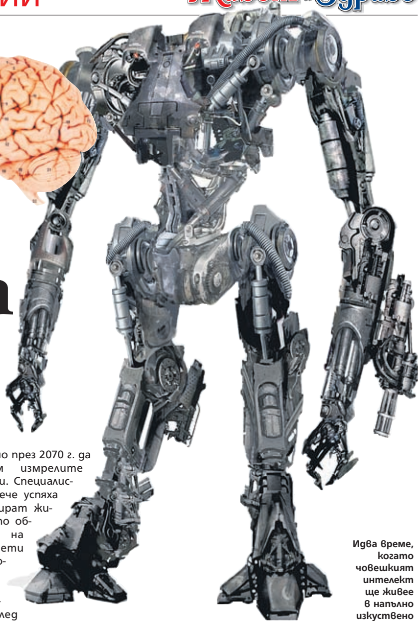
Игва време, когато човешкият интелект ще живее в напълно изкуствено тяло

Тогава може би земната цивилизация ще победи рака. Каку свързва това очакване с пробивите в областта на диагностиката: въградени в тоалетните чинии ДНК-чипове ще позволят да се открие заболяването в много ранен стадий. А за борба с раковите клетки (думата "тумор" ще излезе от езика, убеден е