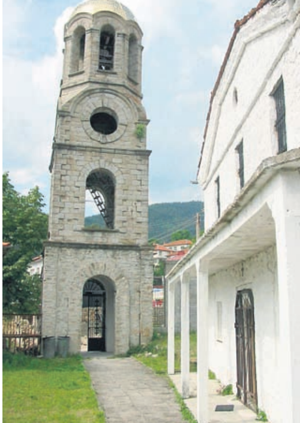
В село Славеино има уникална църква

Всички знаят, че горещата ванна е отличен начин да релаксираш след тежък работен ден. Експерти от Йейл обаче доказаха, че водата може да намали чувството за самота и изолация. Проведеното от тях изследване установило, че колкото повече човек се чувства сам, толкова по-често и по-продължително взима ванна или душ и толкова по-гореща е водата.