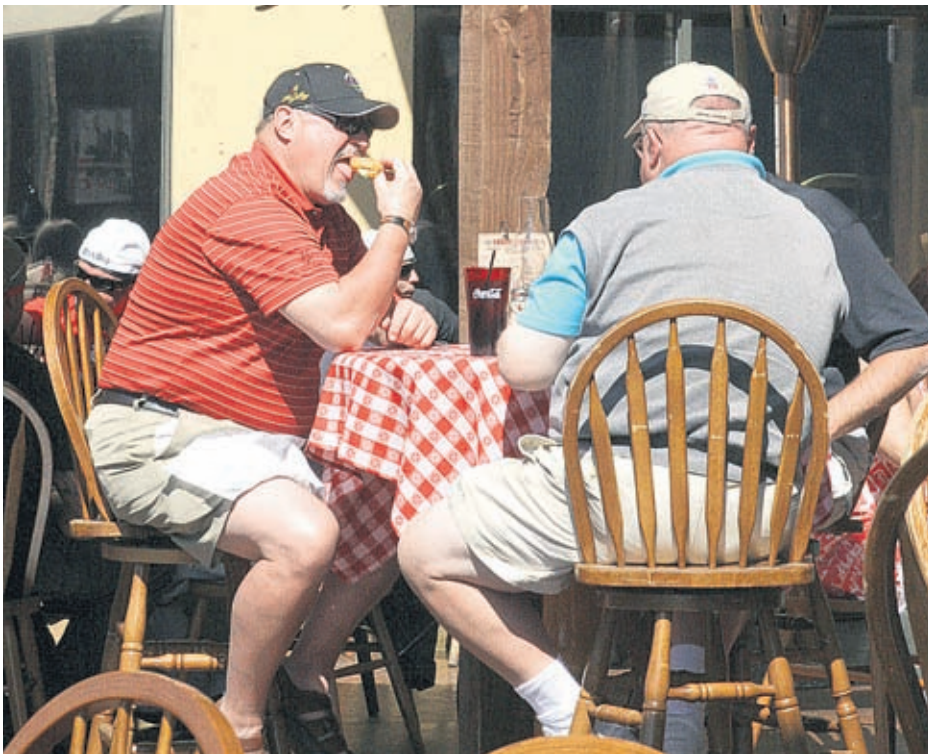
Освен хепатита преяждането и препиването също увреждат черния дроб

проблеми. По-сериозно е заболяването от другите два основни вида вирусен хепатит - "В" и "С". Те се предават главно по кръвен и по-рядко по полов път. Основният риск е свързан с непрофесионални кръвни манипулации при венозни наркомани, пиярсинг, татуировки. Все още има заразени и при медицински процедури в стоматологията, урологията, гинекологията, хирургията. Затова е много важно да се посещават само лицензирани кабинети и здравни заведения. Невинаги след заразяването се развива типичната клинична картина на остро заболяване с пожълтяване. Понякога инфекцията протича без особени първоначални симптоми, а се установява едва от хроничните чернодробни увреждания. Рискът от тях при хепатит "В" и "С" е значителен. Става въпрос за развитие на чернодробна цироза и първичен рак на черния дроб. В