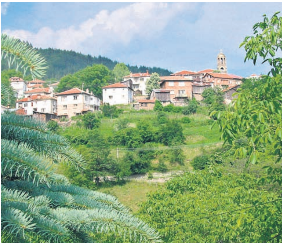
Когато говорим за здраве, мислим за Родопите

- До голяма степен! Истинските родопчани наблягат на простите храни - боб, картофи, царевича, мляко. Не пържат, хранят се с печено и варено. От време на време хапват яйца или крехко месо. В Родопите няма да видите хора с коремци, преяли и препули. Излишъците са им органично чужди. По света доста се говори за Средиземноморската диета, а аз създадох клуб "Родопско здраве", за да покажа, че