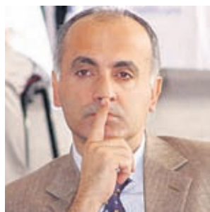
Проф. Семих Халезероглу

Проф. Халезероглу, вярно ли е, че броят на болните с рак на белия дроб се е увеличил през последните години и какви са причините?