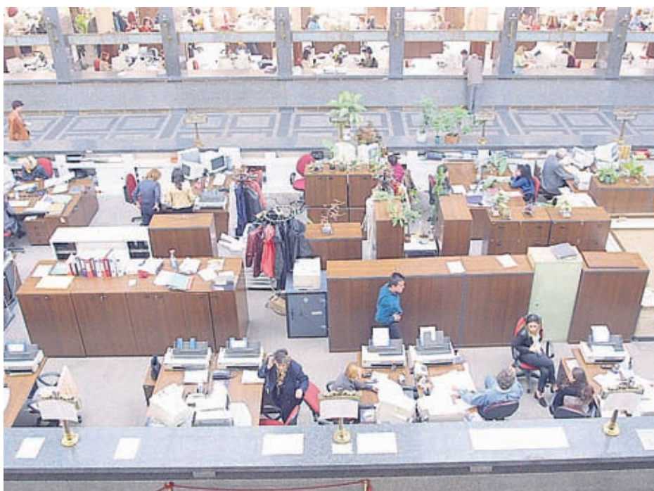
Продуктите, които предлагат банките, са все по-разнообразни и достъпни

- Конкуренцията между банките е доста сериозна, ето защо и продуктите, които предлагат, стават по-разнообразни и достъпни. Всеки би могъл да прецени какво е нивото на обслужване, за мен лично нивото на банковите услуги у нас никак не е лошо. Естествено има и оплаквания, но те са неизбежни в която и да е сфера. Например при едностранна промяна на лихви по кредит доста потребители остават