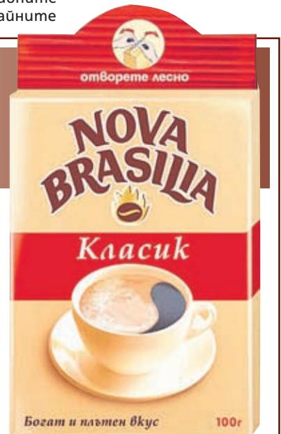
"Nova Brasilia" - истината наистина е в пакета

изследователи добавят днес серия нови плюсове: в малки дози, твърдят те, кофеинът стимулира централната нервна система и най-вече кората на главния мозък, подобрява цялостната обмяна на веществата и жизнената дейност на всички тъкани, ускорява и усвояването на възлехидратите. Кафето е и силен антиоксидант. Що се отнася до минусите (защото нали във всичко има и плюс, и минус)... като минус на кафето специалистите отбелязват системно един и го именува "пристрастяване": липсата на кафе причинява нерядко усещане за умора, причинява спад на концентрацията, понижава самочувствието. Поради което е добре винаги да имаме нещо в запас. Едно, макар и малко, но добре вакуумирано пакетче с мляно кафе - за бързо спасение и за чудесен нов ден, със запазена сила и гарантиран аромат. И с име "Nova Brasilia" - неизменният лидер на пазара на млени кафета у нас. Въпреки кризата в потреблението и все потрудната конкурентна среда.