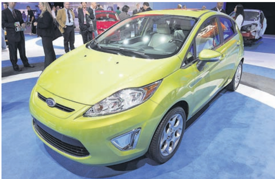
Ford Fiesta, както и миналата година, е най-продаваният модел у нас за първите седем месеца

страната на BMW с моделите X6 и X5. След тях се нареждам Toyota Land Cruiser, Mazda CX7, VW Touareg. В общите продажби за седемте месеца продължава да води от началото на годината марката Volkswagen, която заедно с Ford и Toyota са единствените минали кола 1000. В следващите броеве ще ви запознаем по-подробно с някои от най-търсените модели у нас.