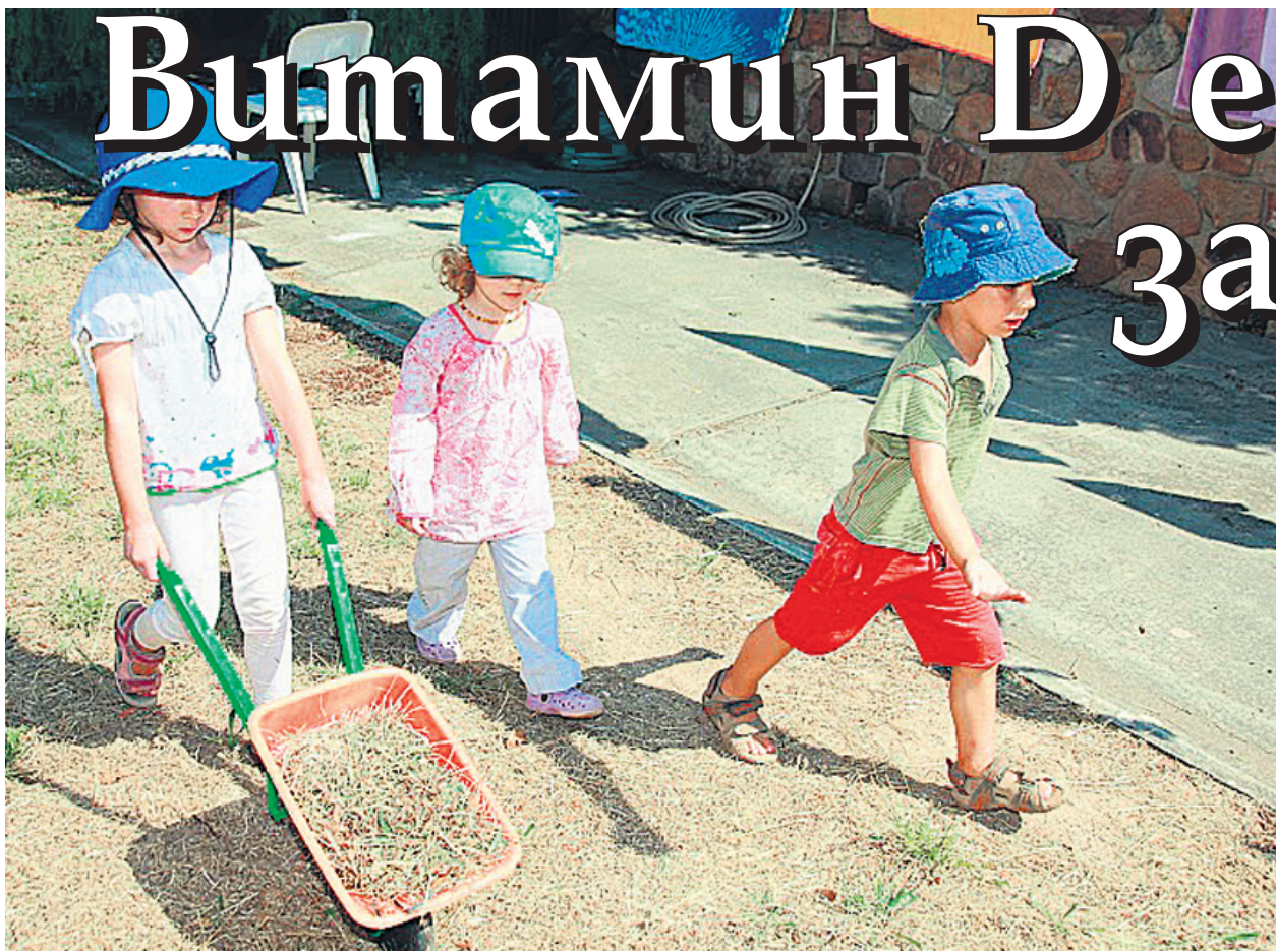
Излагане на слънце и прием на специални препарати гарантират здравето на децата