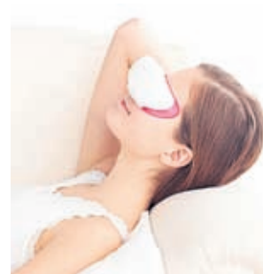
Как да помогнем на очите си?