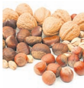
Зимно изкушение с дъх на Коледа