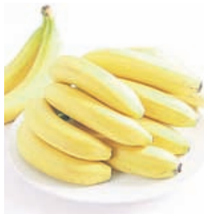
Менюто на Сънчо