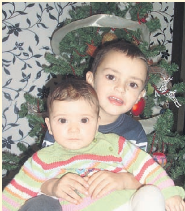
Снимки Поли ГЕОРГИЕВА, София