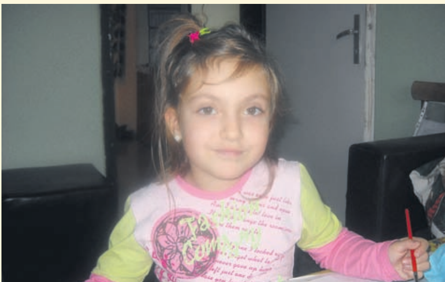
Илюстрации към вечната приказка "Моите внуци"

Уважаеми читатели, изпращайте снимки на info@health.bg и на znanieto@yahoo.com