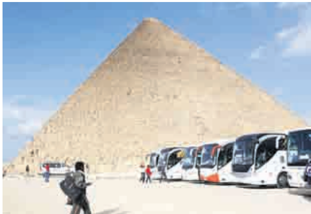
Пирамидите на фараоните Хеопс, Хефрен и Микенин, както и Сфинксът са единствено запазени от Седемте чудеса на древния свят, но не са пощадени от тълпи туристи по всяко време на годината и балансът естествена среда-посетители отдавна е загубен

хотелиери. За да осъществяват дейността си на място, те използват изцяло местен транспорт, местен персонал и местни храни и напитки за своите туристи. Групите са малки - от двама до 15 души, така че присъствието на чуждите да не пречи на нормалния живот. Екскурзоводите са специално обучени да водят своите подопечни така, че да не се руши природата или нормалният ритъм на живот.