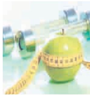
Хранене според зодията