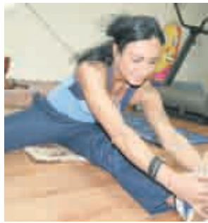
Трикове за изящна фигура