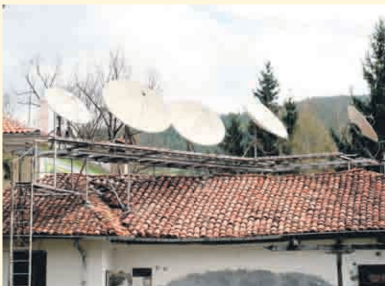
Може да не сме богати, но пък сме информирани...

Уважаеми читатели, изпращайте снимки на info@health.bg и на znaniето@yahoo.com