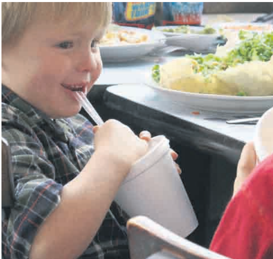
Внимавайте с пластмасовите чаши