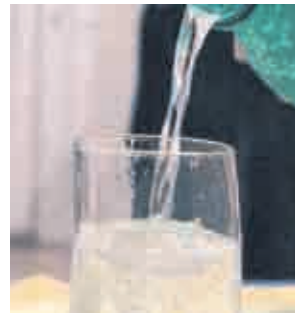
Здрави отвятре и отвън