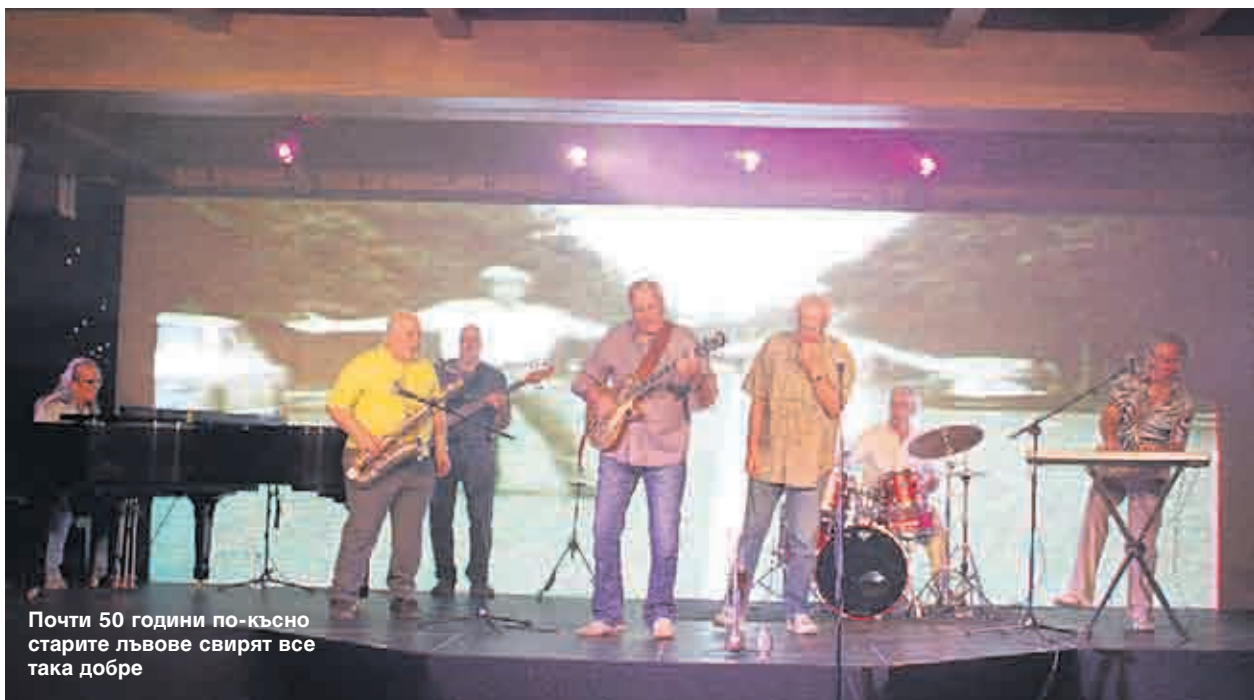
Почти 50 години по-късно старите лъвове свирят все така добре

разказ е изграден като едно вглеждане в критериите за качество в изкуството. Качество, което в музиката е било постигнато през 60-те и