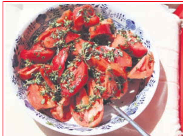
За салатата направете обичайната подготовка на зеленчуците. Измийте и отръскайте стъблата тученица от излишната вода и я нарежете на дребно. Подправете на вкус

сирене или да я хапвате самостоятелно. В Гърция я варят и поднасят като студена гарнитура заедно със скордаля (чесново-орехово-хлебен сос). Тя идеално замества част от магнезия в прочутото табуле или марулята в леки летни сандвичи. Съчетава се чудесно с чесън, рукола, босилек и кардамон, които улесняват храносмилането ѝ. Тученицата е вкусна и приготвена като яхния. Тя замества напълно спанак в много рецепти. От нея се правят супи, а също така и банници.