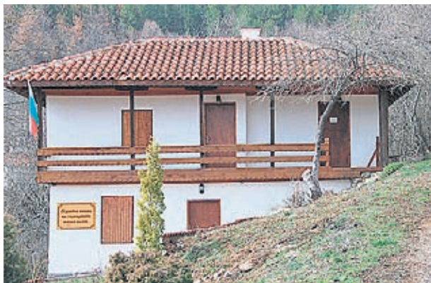
Музей на киселото мляко в село Студен извор, община Трън

"Обучаваме фермерите как могат да се обединят в клъстери - нещо, което им е доста далечно, за да повишат качеството на работа и да улеснят веригата производство -