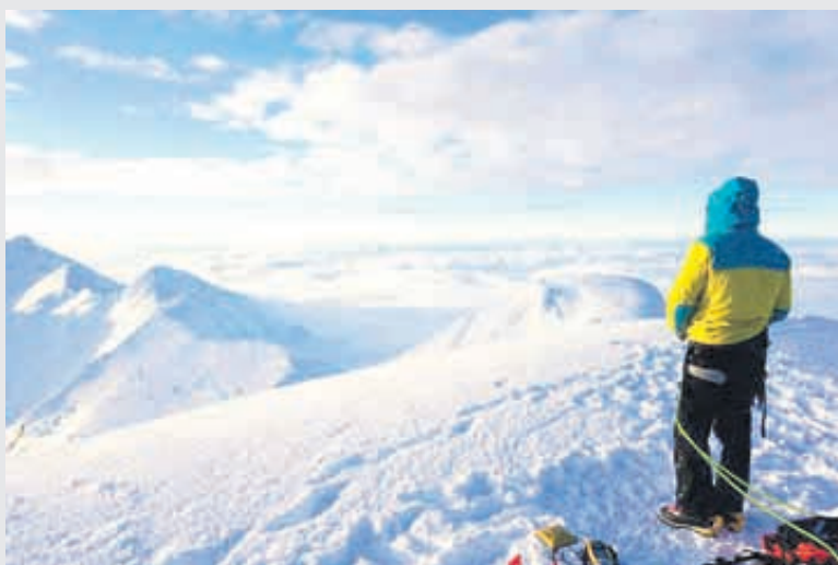
В Антарктида вече има връх София