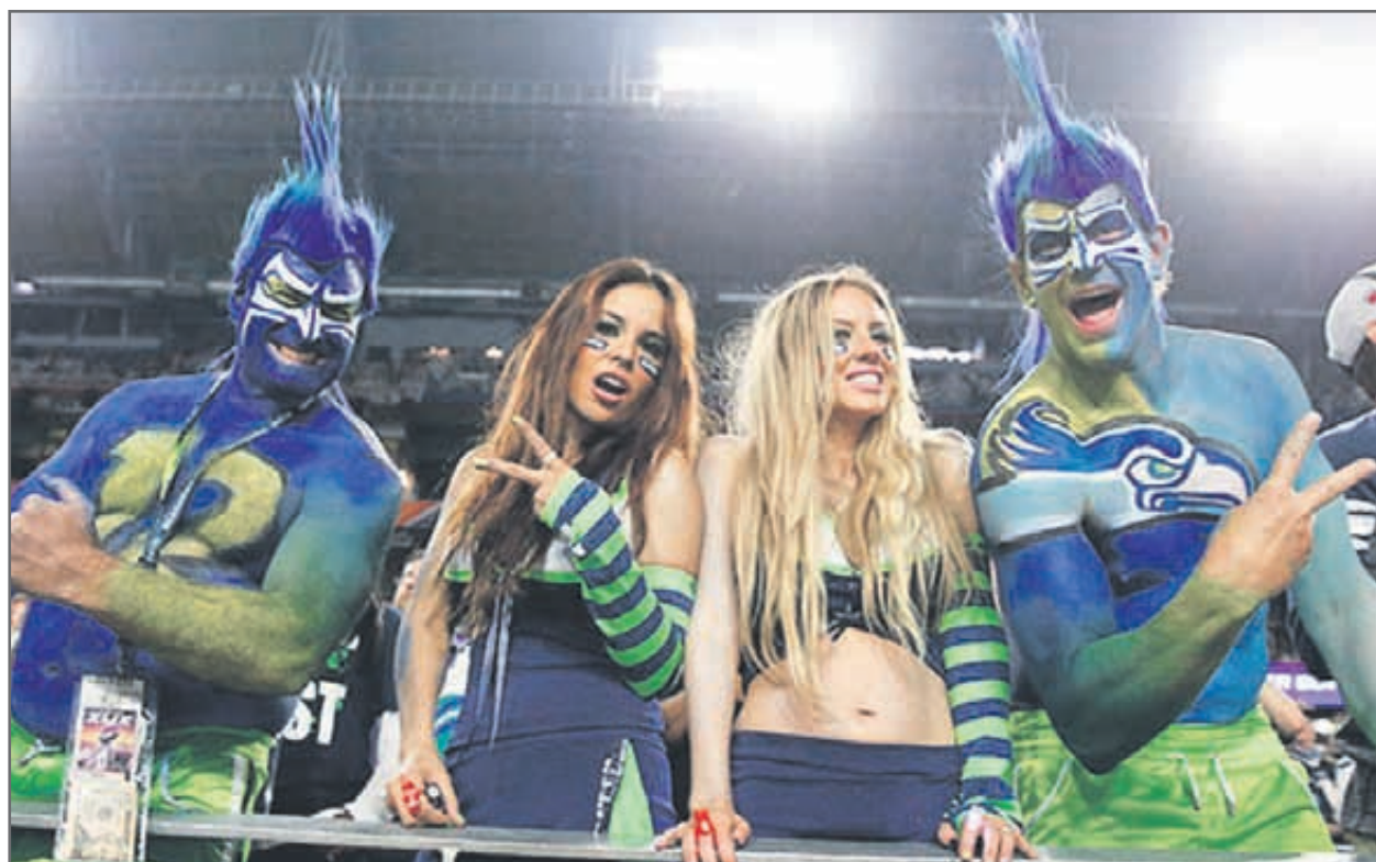
Независимо от загубата с 24:28 в 49-ото издание на Супербоул от Ню Ингленд феновете на Сиатъл демонстрираха добро настроение на трибуните