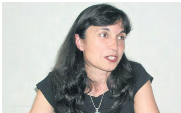
Цвета БРЕСТНИЧКА, Асоциация „Родители“

да заведе своите две или три деца в различни училища по едно и също време. Бих искала да има правило за прием, което родителите да следват стъпка по стъпка. Ние хем сме уязвими относно много опашки, хем за нас това е показателно за популярността и доверието към училището ни. А смятам, че е нормално и родителите да искат децата им да учат в училище, където има добър учителски екип и се постигат успехи.