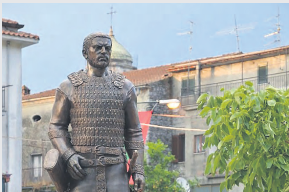
В италианския град Челле ди Булгерия бе открит паметник на българския хан Алцек