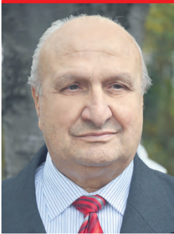
Акад. Григор Велев