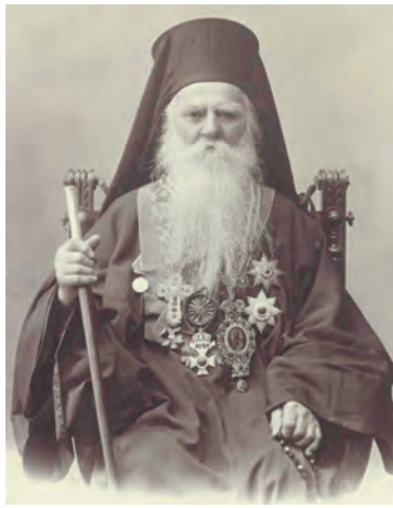
Охридски митрополит Натанаил

- На 5 октомври 1878 г. сборен отряд от няколко чети, възлизащ на 400 въстаници, под общото командване на Стоян Карастоилов - Стоян войвода, и Адам Калмиков атакува турските войски, дислоцирани при кресненските ханове. След 18-часово сражение османлиите се предават. Пленени са 119 войници и 2 офицери. Освободени са селата Влахи, Ощава, Ново село. Създадено е въстаническо ръководство в състав: атаман Адам Калмиков, началник-щаб Димитър Попгеоргиев и главен войвода Стоян Карастоилов.