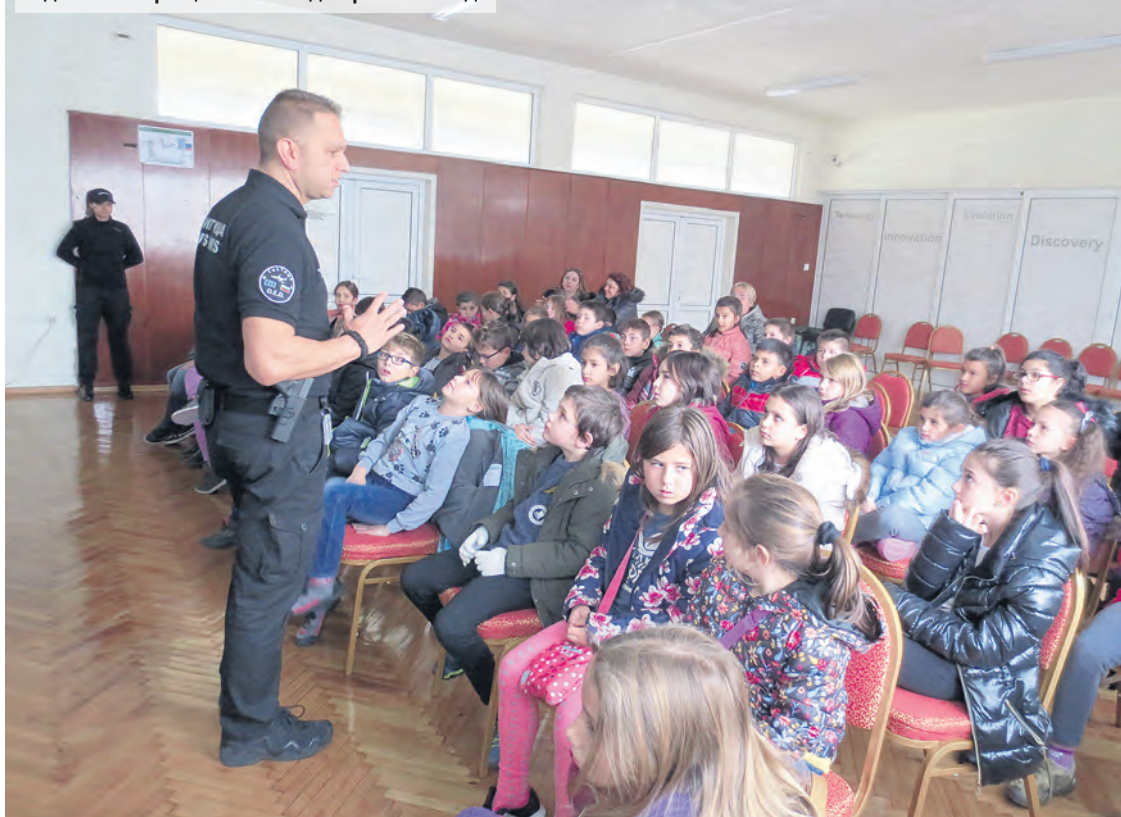
Годишните срещи с тийнейджъри са хиляди

Преобладават синтетичните канабиноиди и синтетичните катинони, свръхтоксични. Всеки може по интернет да си поръча подобна пратка наркотик, доставката става за денонощие. Идват предварително пакетирани, трафикът се извършва в големи пликчета, които се укриват по един или друг начин. Печелят най-вече от това, че използват интернет, не им трябва да поддържат верига от дилъри – доставчици. Произвеждат какво ли не и къде ли не. Същевременно новите екстази стават все по-силни, все по-токсични, а уцелените потребители са направо опитни мишки. Обновяването на тази синтетика е толкова скоростно, че няма време да се изучат последиците, т.е. все по-трудно е те да бъдат овладявани. Плашеща, много страшна е тази възможност