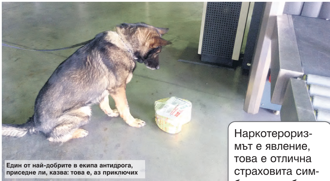
Един от най-добрите в екипа антидрога, приседне ли, казва: това е, аз приклячих

- Гълтачите са основно на терена на кокаина. Има, хващаме всяка година. Има всякакви, има и дами. Най-изпечената се оказва със стаж над 15 курса - предпенсионно, на възраст малко над 60. Гълтачите биват специално