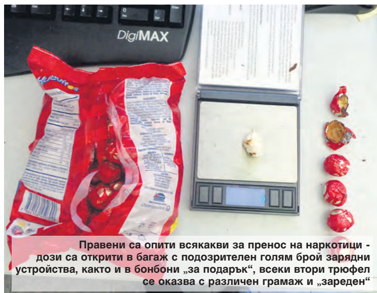
Правени са опити всякакви за пренос на наркотици - дози са открити в багаж с подозрителен голям брой зарядни устройства, както и в бонбони „за подарък“, всеки втори трюфел се оказва с различен грамаж и „зареден“

- Стои мощта на каузата - сигурността на хората, опазването на децата. Абсолютен приоритет.