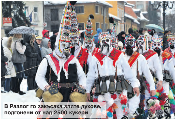
В Разлог го закъсаха злите духове, подгонени от над 2500 кукери

Оксфорд обяви „постистина“ за дума на годината, което ни вкара в лингвистичен капан. В крайна сметка схваната, че идеята не е лоша, но е въздълбокомислена. Пък и истината трудно вирее върху чукарите на постсоциалистическата ни нравственост. Затова предлагам наша дума, но на седмицата, която няма да провокира ничия интелигентност – „закъсахме“. Универсален глагол, простичък и непретенциозен, който може да се пришие към почти всяка ситуация от последните дни. Дали ще са коли по магистралите, селца без вода или ток, тарикати, кметове – кандидати да закъсат винаги се намират и навсякъде. Разликата е само в граматичното време. За едни това предстои. Стрелецът по такси в столицата например или митничарите на пристанище Варна все още са на старта и спринтът към нелицеприятната страна на живота предстои. Но пък трябва да им признаем, че направиха каквото можаха, за да се набутат в лабиринта от алинеи и членове. Около пловдивския кмет също тепърва ще се затяга примката на закона. Въпреки че ме гризат едни съмнения