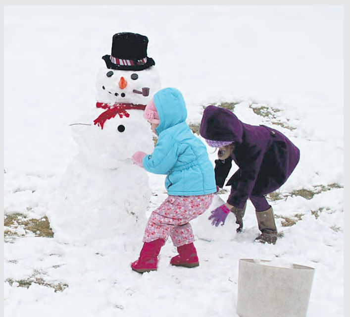
Докато възрастните не спират да правят аналогии между зимата и бедствията, децата са във възторг от дебелия сняг