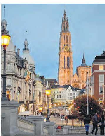
Антверпен стана първият град в Белгия, в който забраниха движението на т.нар. „мръсни“ автомобили в централната

През 2016 г. брутният вътрешен продукт на Филипините нарасна с 6,8%, като изпревари дори Китай, чийто икономически ръст е 6,7%.