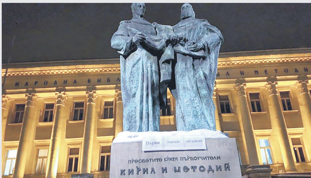
Най-емблематичните паметници в столицата „се включиха“ в акцията „Диша ми се“. Тя се опита, надяваме се успешно, да привлече вниманието към изключително мръсния въздух в София. Инициаторите са неправителствената организация „Спаси София“ и артистът Ивайло Христов