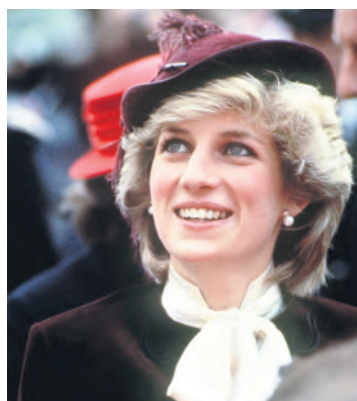
Синовете на принцеса Даяна – Уилям и Хари, решиха да почетат паметта на майка си, загинала преди 20 години. Те са поръчали нейна статуя в цял ръст, която ще поставят в

данни на Eurostat 15,3% от пълнолетните жители на Франция страдат от наднормено тегло. Това е малко под средното за ЕС ниво, но ситуацията се влошава. В страната вече действат редица закони, ограничаващи достъпа до нездравословна храна, но затлъстяването на населението продължава да бъде сериозен проблем.