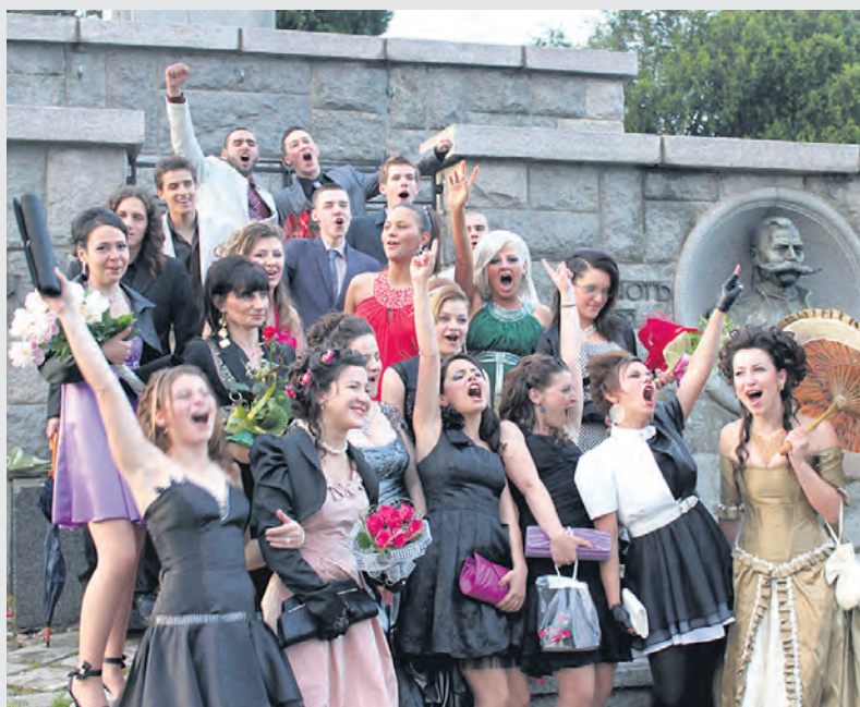
Завършиха великденските празници, но пък се задават абитуриентските вълнения