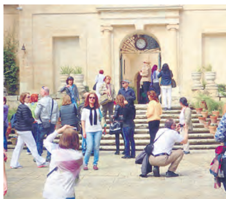
Участниците в пътуващия семинар на фондация „Виделей“ в градината на президента на Малта

демонстрации на различни древни ритуали.