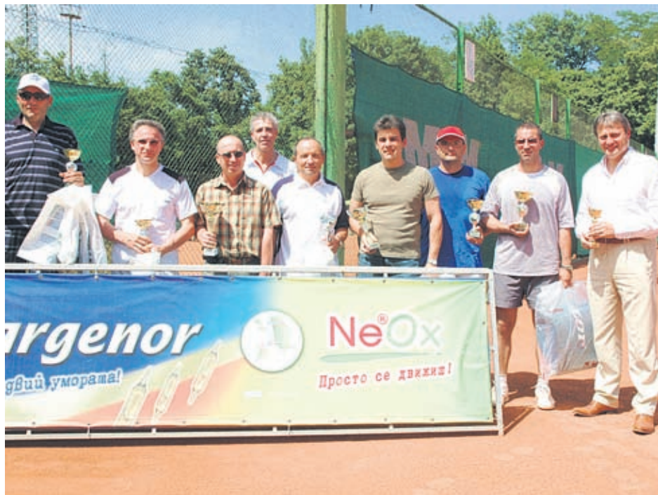
Всички горди призъори от Sargenor Cup 2009

На 5 и 6 юни ще се проведе Четвъртият национален тенис турнир Sargenor Cup за лекари