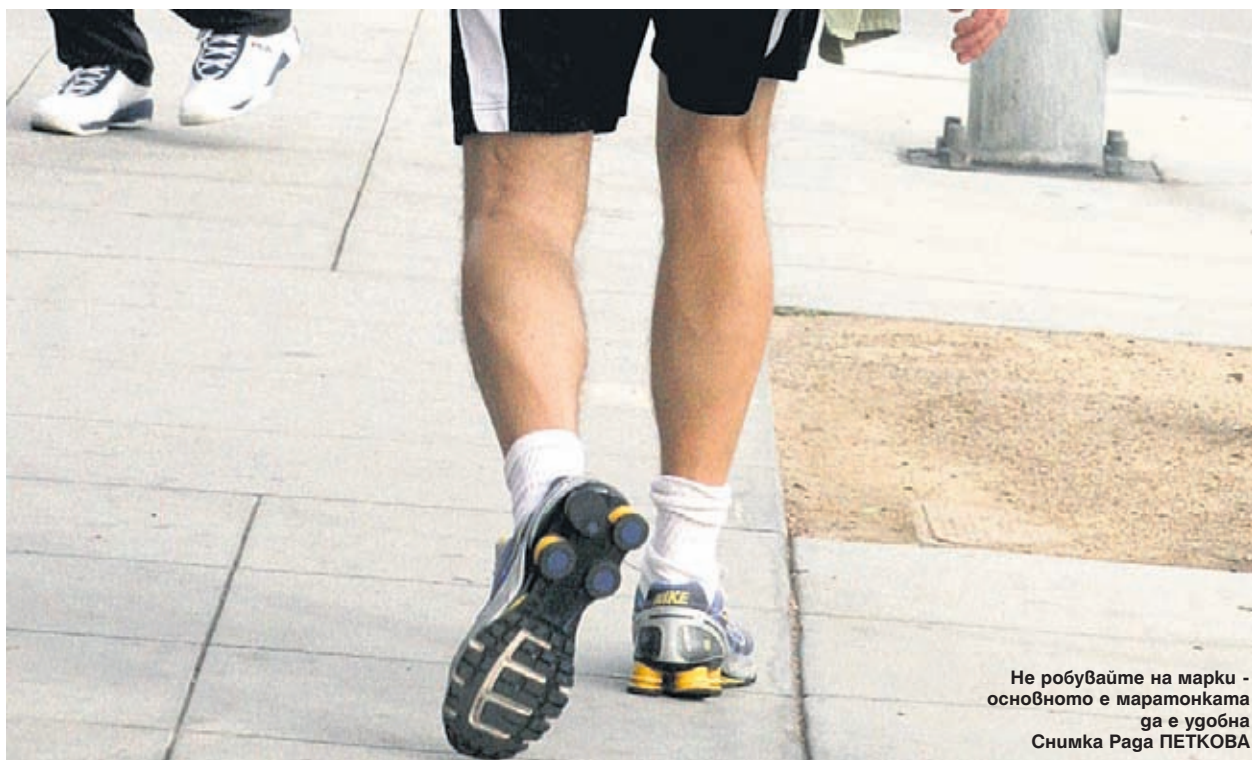
Не робувайте на марки - основното е маратонката да е удобна

Новите модели се правят от високотехнологични материали, които контролират движе-