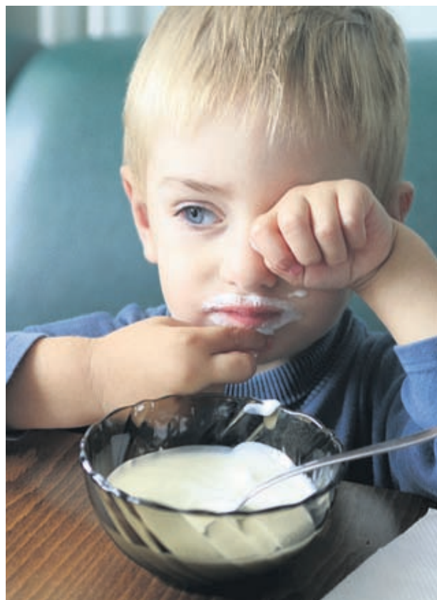
Киселото мляко винаги е било един от най-добрите приятели на детското здраве

"Проблемът с качеството на киселото мляко се корени в липса-