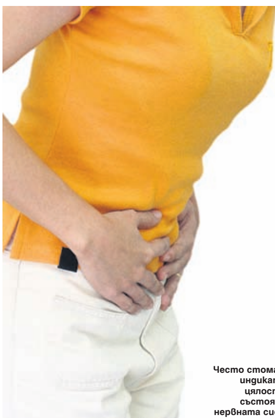
Често стомахът е индикатор за цялостното състояние на нервната система

Основните оплаквания при нервния стомах, наричан още функционална диспепсия, са свързани с чувство на бързо засищане след нахранване, тежест и подуване на стомаха, спастични болки, упорити уригвания и къркорене в корема, парене под лъжичката, внезапно чувство на силен глад и гр. По принцип тези симптоми могат да бъдат причинени от редица заболявания, затова, преди да се приеме, че става въпрос за диспепсия, задължително трябва да се изключат органични болести. А това е в прерогативите само на опитен гастроентеролог!