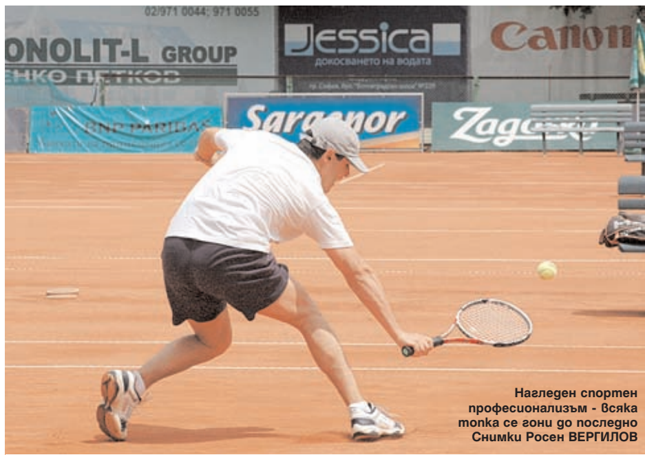
Нагледен спортен професионализъм - всяка топка се гони до последно