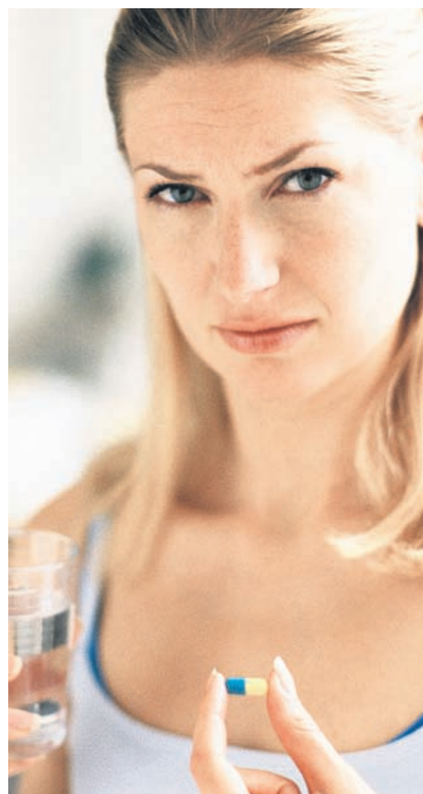
Най-добре е хапчетата да се прегълтат с вода, а не с безалкохолни газирани напитки

Репички, ряпа, зеле, маруля - вкусните зеленчуци могат да намалят ефекта на хормоните от щитовидната жлеза. Ако назначените ви лекарства предотвратяват образуването на кръвни съсиреци, не е желател-