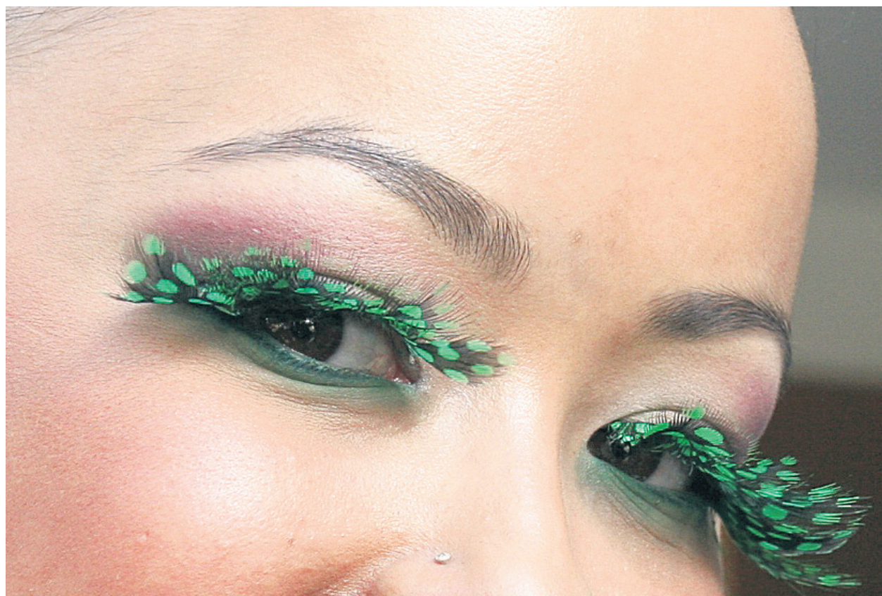
Дайте почивка на сложните гримьорски техники през летните месеци

Балсамът за устни е задължителен. Той трябва да има слънцезащитен фактор и да овлажнява устните. После нанесете червилото или блестящия гланц. Молива за устни оставете за есента, тъй като слънцето лесно ще го размаже. Ако не мо-