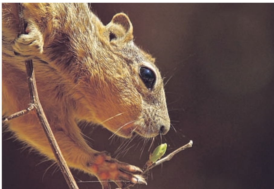
Тази снимка, дело на Иван Анчев, бе сред наградените от фотоконкурса на Allergodil - „Екофарм“