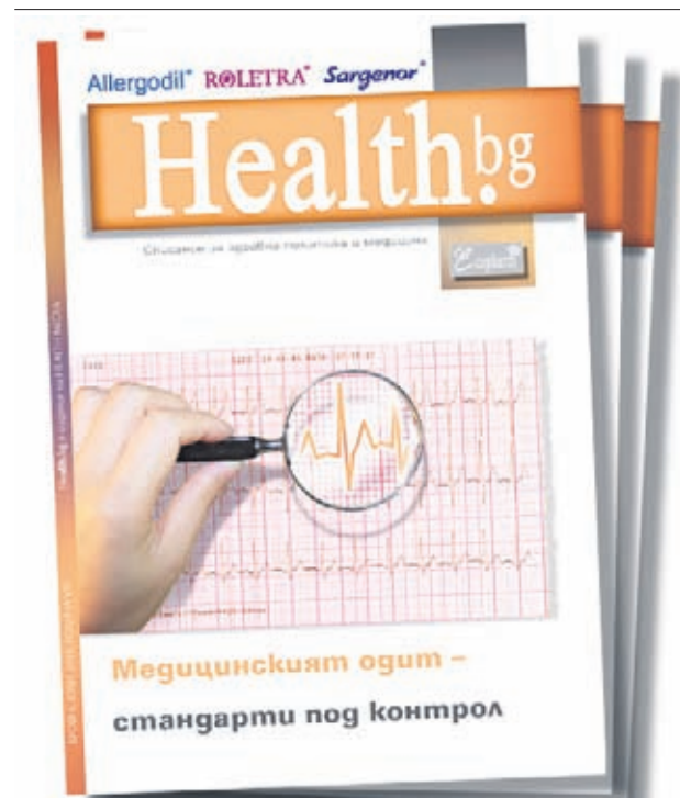
Във фокуса на новия брой на националното списание за здравна култура и медицина е медицинският огит

Но на кого ли му пука - нали Земята продължава да се върти и ние се возим безплатно. А "Ройтерс" ни обявя за попфолк република.