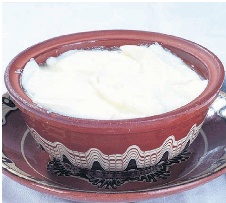
Когато не сме сигурни, че киселото мляко е истинско, можем да приемаме пробиотични препарати

Имунитетът, осигурен от добрите бактерии в лигавицата на червото - това е най-мощната преграда срещу опасните външни фактори - микроби, вируси, токсични продукти и храни, канцерогени, посочва проф. Стойнов. Нормалната флора освен това подпомага възстановяването на лигавицата при естествения процес на стареене на клетките. Същото е при възстановяването на увредената по различни причини чревна