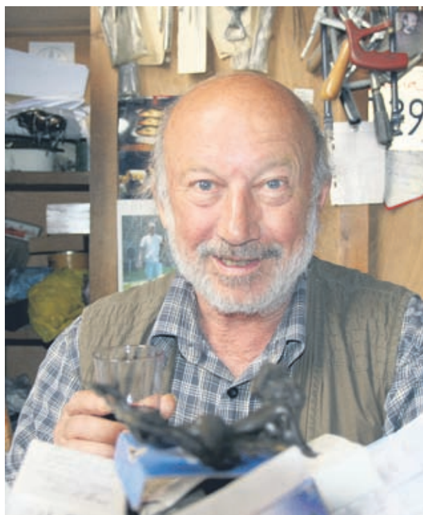
Чапа не крие, че предпочита лятото дори пред най-красивата зима

- Не е толкова важно къде и колко работи имаш, хубавото е, че не ме забравят, аз пък си гледам работата и така върви животът.