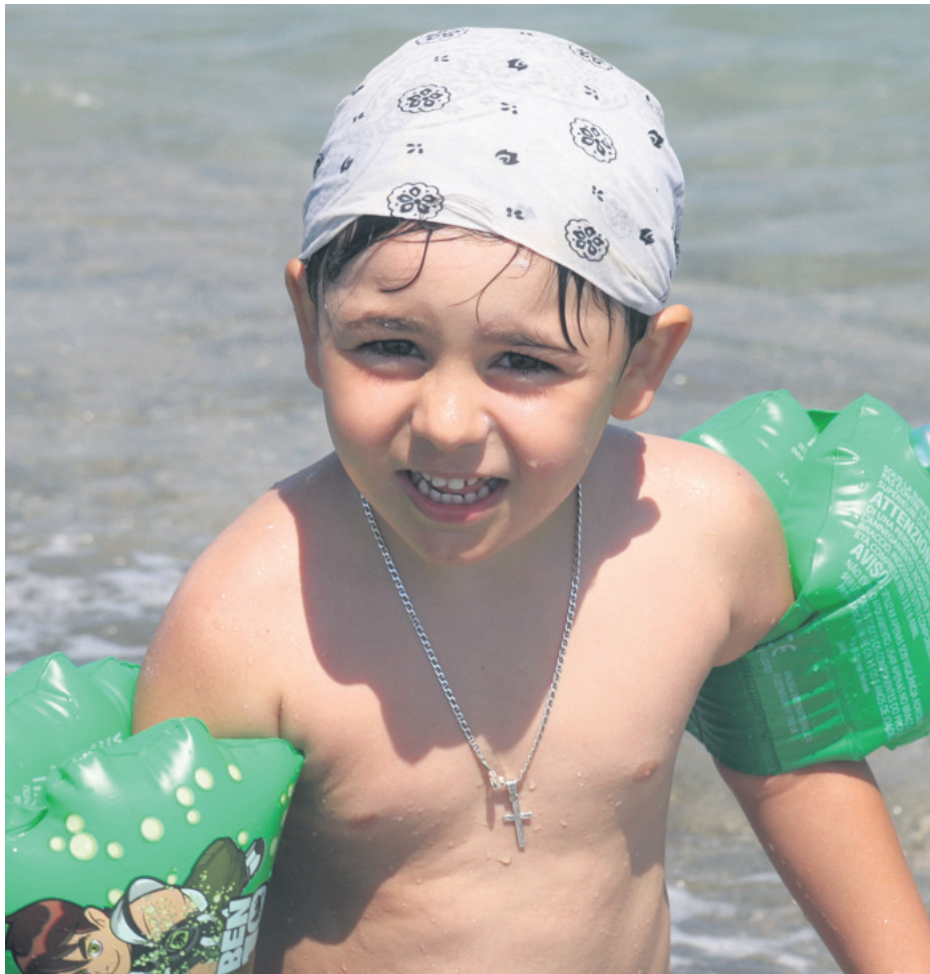
През лятото за децата най-подходящи са т.нар. физическите филтри -плътни кремове, които отблъскват опасните слънчеви лъчи по физичен, а не по химичен път

- Мярката е различна за отделните хора според техния тип кожа, но