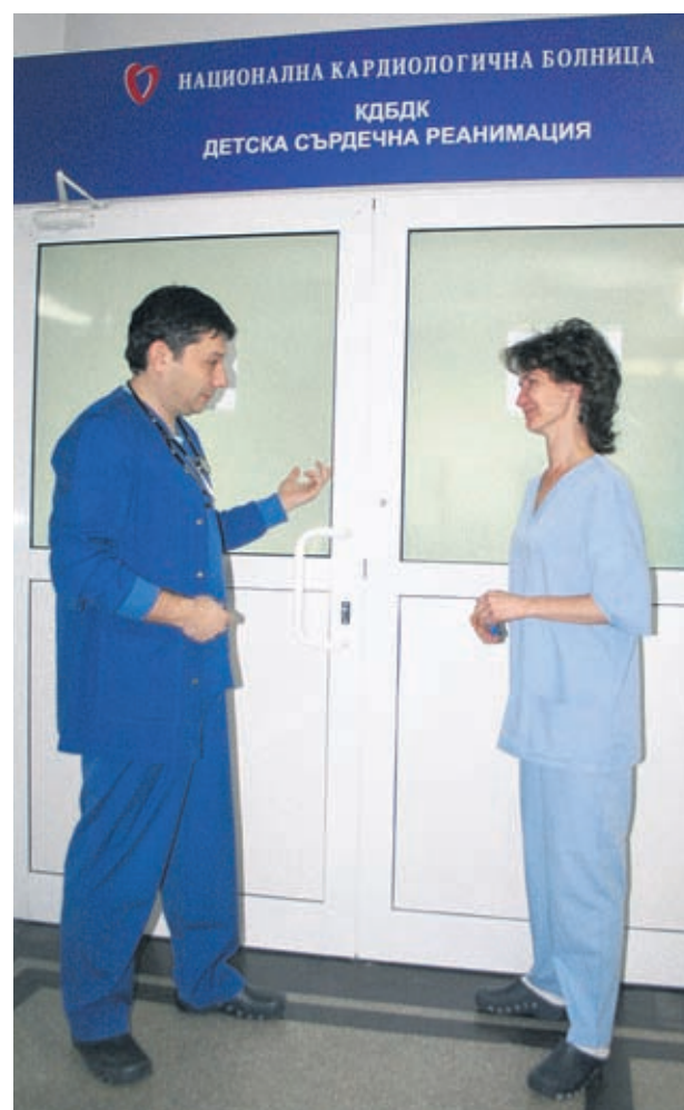
Значителният напредък в детската кардиология и кардиохирургия спаси хиляди деца с тежки вродени пороци

- След като медицина-та успя да овладее до го-