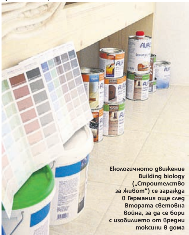
Екологичното движение Building biology („Строителство за живот“) се заражда в Германия още след Втората световна война, за да се бори с изобилието от вредни токсини в дома

ей така, от любопитство. Там ще получите информация за най-новите продукти, които се предлагат на пазара, и отговор на всичките си въпроси.