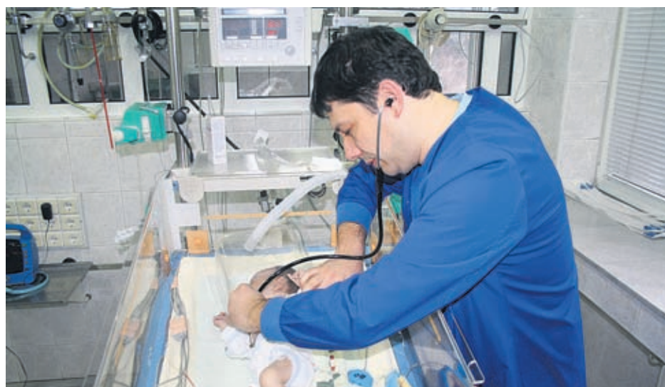
Лечението на децата в Националната кардиологична болница съответства на всички европейски стандарти в тази област

за него и какво не още от детството. Това е въпрос и на семейството, но и на държавата. Ако страната ни влага усилия и средства в профилактика, плодовете ще се берат след години, но това е правилният път. Най-просто е родителите да настояват поне веднъж годишно да се измери кръвното на детето им и при отклонения състоянието да се проследят.