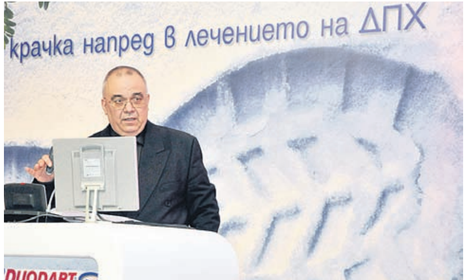
Проф. Панчев обяснява пред лекари съвременните тенденции в лечението на простатата.

- Със сигурност не е добре да се допускат честти възпалителни процеси на половата система и тяхното хронифициране, както и травми в тази област, например от неудобни седалки на велосипеди. За общото състояние на мъжа значение имат също двигателната активност и начинът на