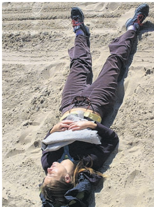
Слънцето е опасно за кожата и през зимата

имунологична памет и помни кога сме се излагали неразумно на вредните слънчеви лъчи при това не само през лятото, но и през зимата. Тя трупя, трупя, трупя и по-късно, с напредването на възрастта, се