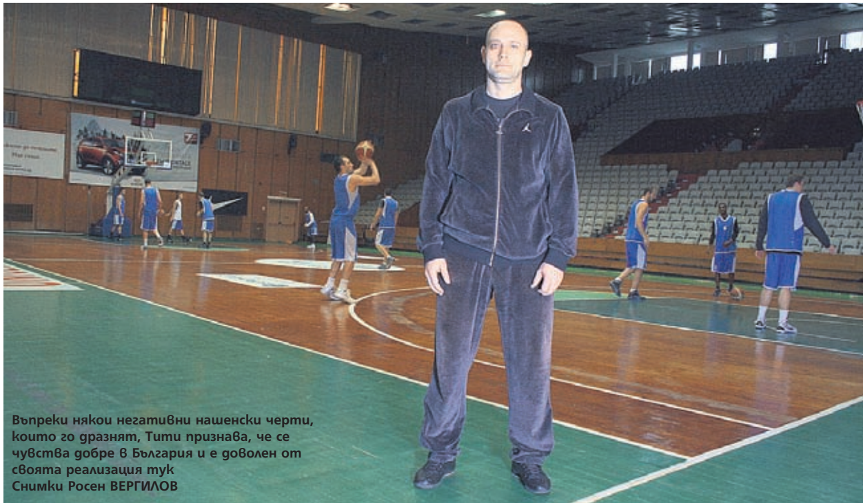
Въпреки някои негативни нашенски черти, които го гразнят, Тити признава, че се чувства добре в България и е доволен от своята реализация тук

Купуваме само лошата информация, доброто не се продава лесно