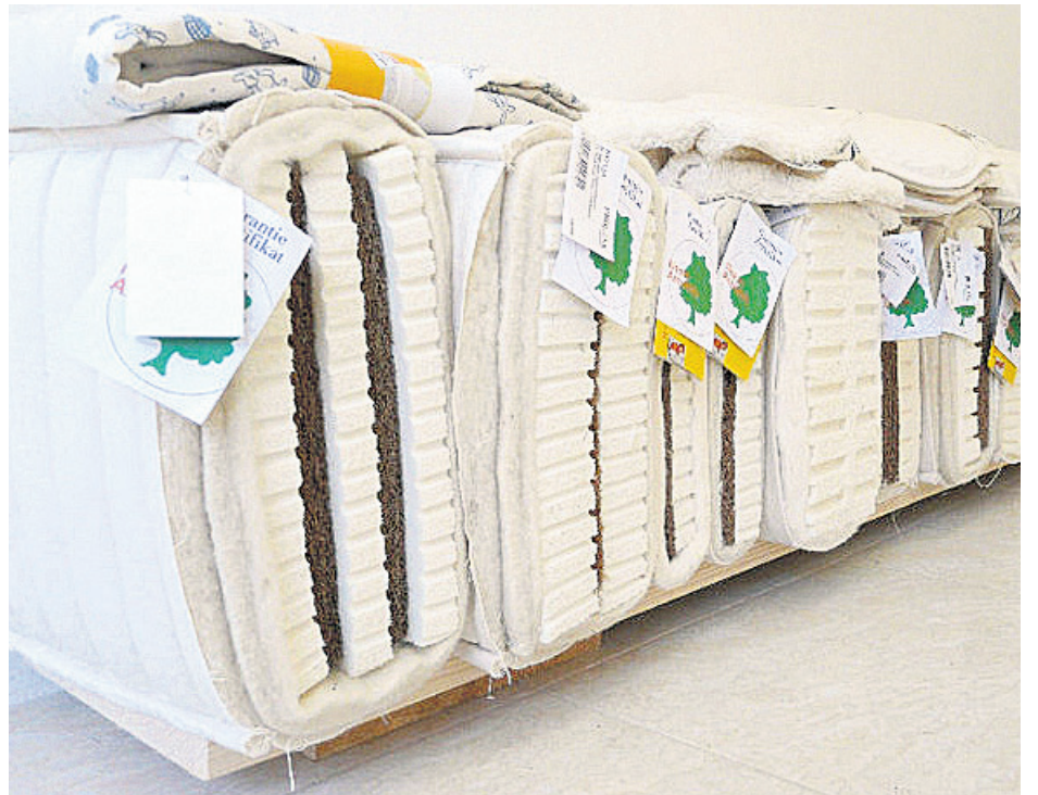
Матраците от естествен латекс гарантират дълбок и здравословен сън

Знаем колко важен за човек е здравословният