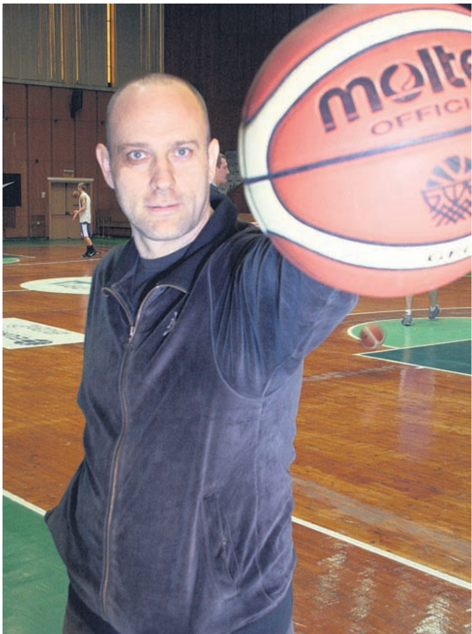
Баскетболът е светът, около който се върти ежедневието на семейство Папазови

Т ити, каква е традиционната програма на твоео семейство по коледно-новогодишните празници?