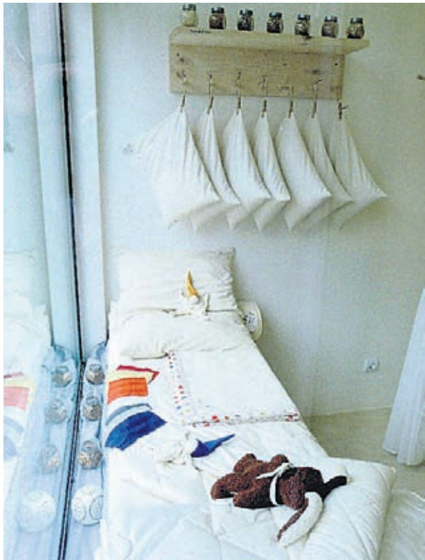
Здравето на малките деца си пада най-много от бързото и некачествено строителство