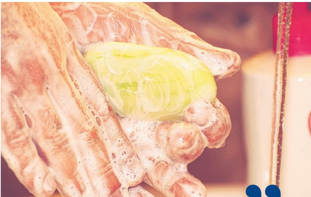
Сапунът си остава едно от основните оръжия в борбата с коварния хепатит А

● Заболяването завършва най-често с пълно оздравяване