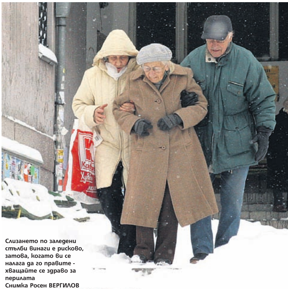
Слизането по залежени стълби винаги е рисково, затова, когато ви се налага да го правите - хващайте се здраво за перилата

с леко сгънати колена. Стъпвайте с цяло стъпало, без да повдигате високо краката. Опитвайте се да усещате всяка вдлъбнатина и издутината на пътя. Не се заглеждате встрани. Не говорете по мобилния телефон, докато ходите. Вниманието ви трябва изцяло да е концентрирано в пътя.