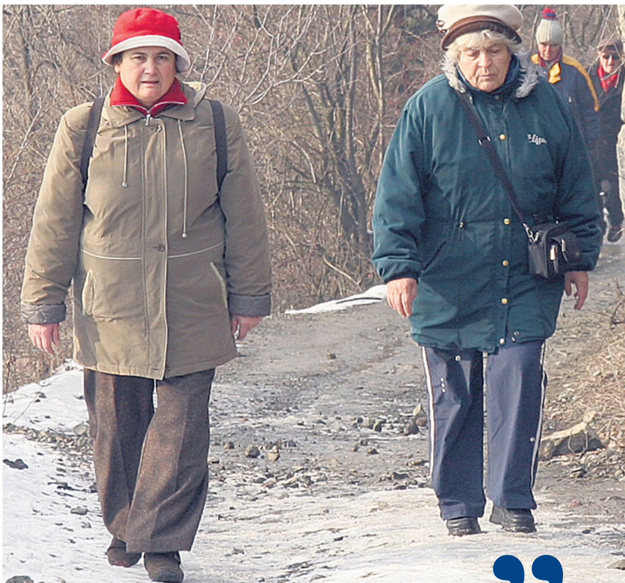
След 60-80-годишна възраст няма човек без артрозни промени