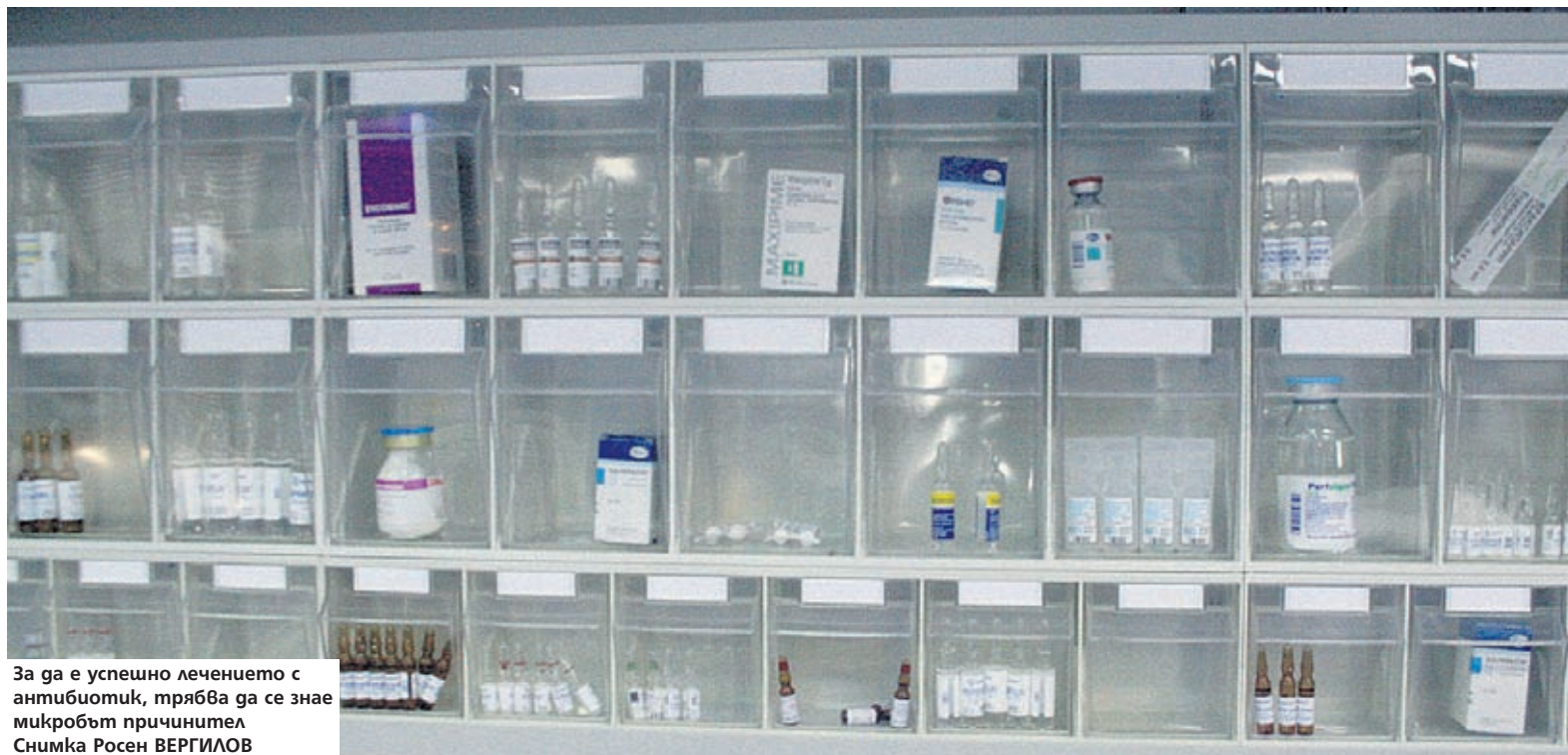
За да е успешно лечението с антибиотик, трябва да се знае микробът причинител