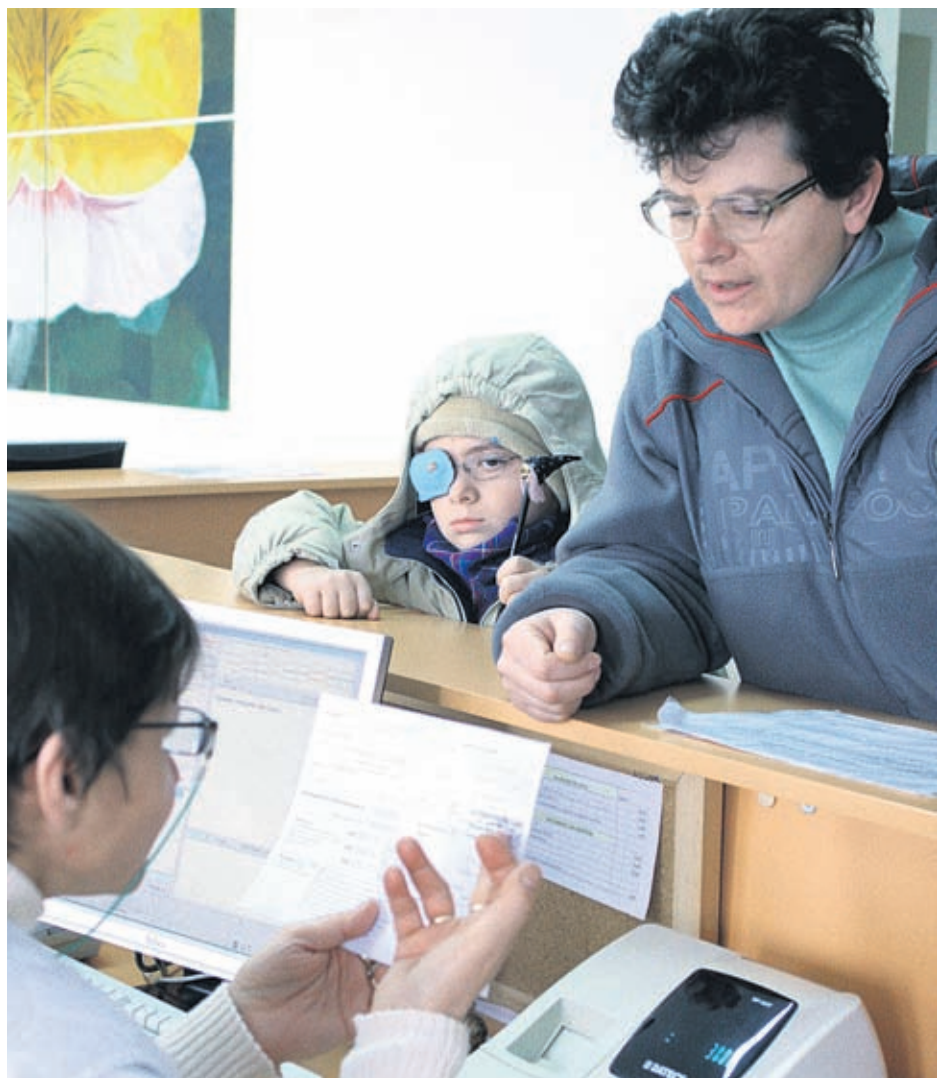
Въвеждането на електронното здравеопазване ще бъде от огромна полза както за пациентите, така и за лекарите в България