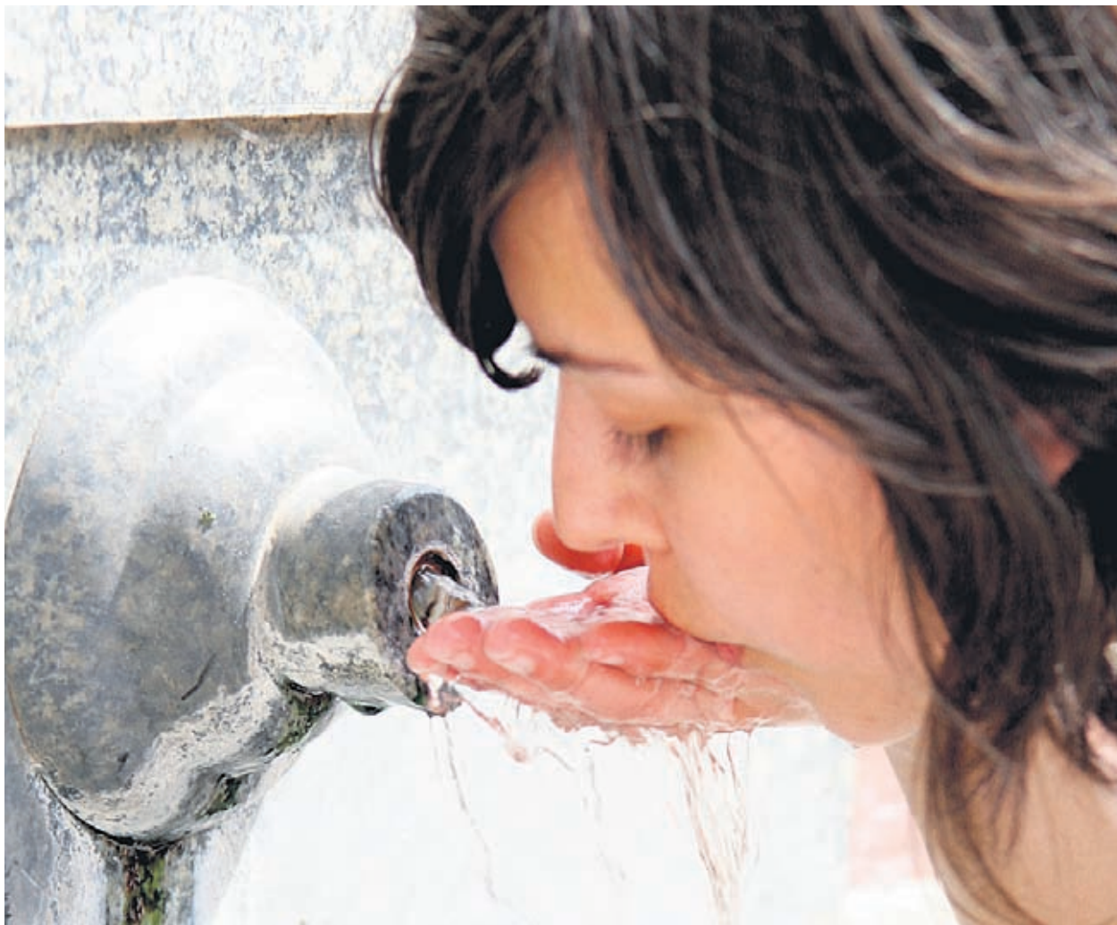
Водата е едно от най-големите природни богатства на земята, затова трябва да бъдем по-рационални в нейната всекидневна употреба