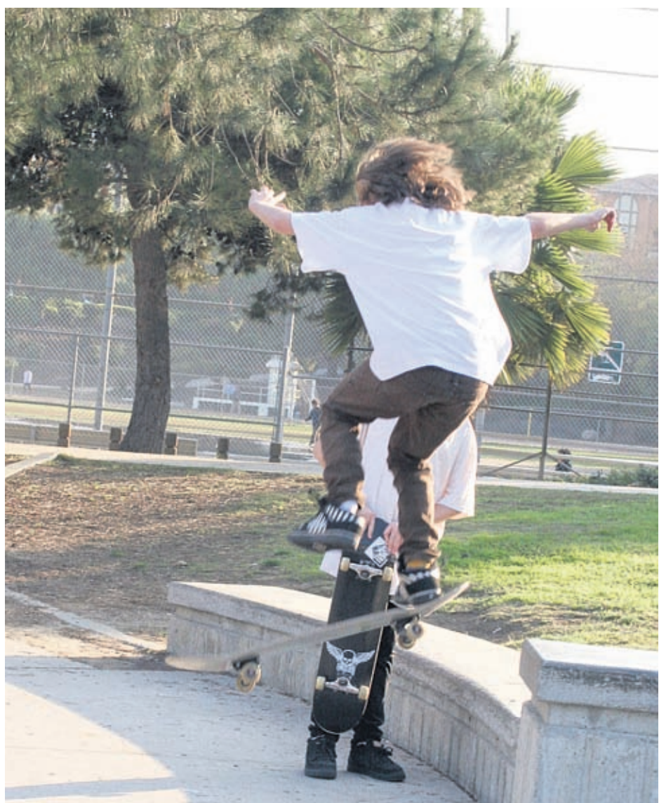
Всекидневното удоволствие от живота подобрява здравословно състояние на човека

Връзката между психиката и физиката е обект на все по-голямо внимание в медицината. Известно е, че хормоните, които се отделят при продължителен стрес, влияят зле на здравословното състояние. Както и при всяко телесно увреждане, стресът предизвиква ответна реакция на имунната система, която е съпроводена от отделяне на свободни радикали. Те от своя страна предизвикват възпаления. Когато процесът е продължителен, той води до много сериозни болести: от ревматоиден артрит до алцхаймер и атеросклероза.