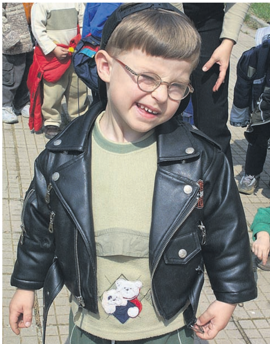
При късогледство специалистите препоръчват до 18-годишна възраст да се носят очила, а в по-зряла възраст - операция с лазер може да реши проблема

- Зависи от типа. Силната миопия трябва постоянно да се следи. Да се оглежда очното дъно, да се внимава да не се отлепи ретината. Усложненията, които могат да настъпят, са повишено очно налягане, глаукома, дегенерация на ретината.