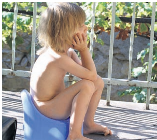
Лаксативните препарати с плодови екстракти са изключително подходящи за малчуганите, които имат проблеми с нередовния стомах