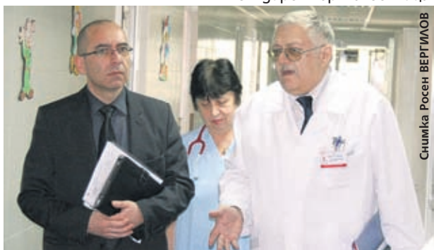
Министър Константинов остана доволен след посещението си в НКБ

Това е стимул хората да плащат редовно здравните си осигуровки, защото често срещу минимална месечна сума след това се ползва скъпо съвременно лечение. Министърът на здравеопазването г-р Стефан Константинов, който посети НКБ, приветства инициативата, защото тя доказва пред пациентите смисъла от солидарния здравноосигурителен модел - всички плащат според доходите си, а при заболяване ползват медицински услуги според нуждите си.