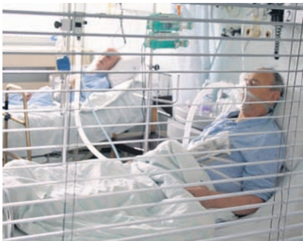
Грипът не е безобидно заболяване и изисква специфично лечение

Много е важно вирусните заболявания да не се прекарват "на крак", защото това допълнително товари организма. Почивката на легло, приемът на достатъчно течности, леката храна и бърза консултация при задълбочаване на симптомите ще ви предпазят от неблагоприятно развитие.