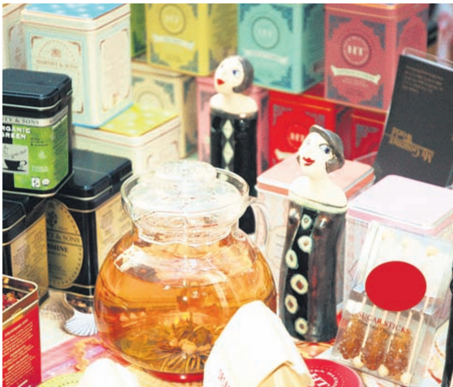
Красивите кутии за чай лесно се превръщат в ефектно украшение за всяка кухня