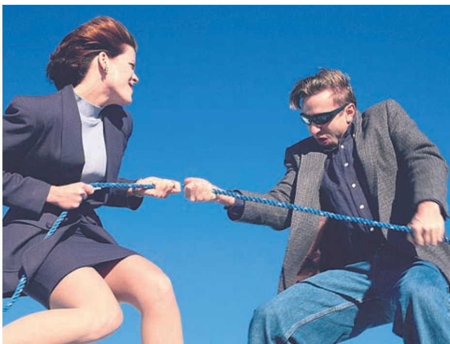
Социолозите твърдят, че нежният пол ще остави силния на втори план

● Желание да докажат, че по нищо не отстъпват на мъжете.