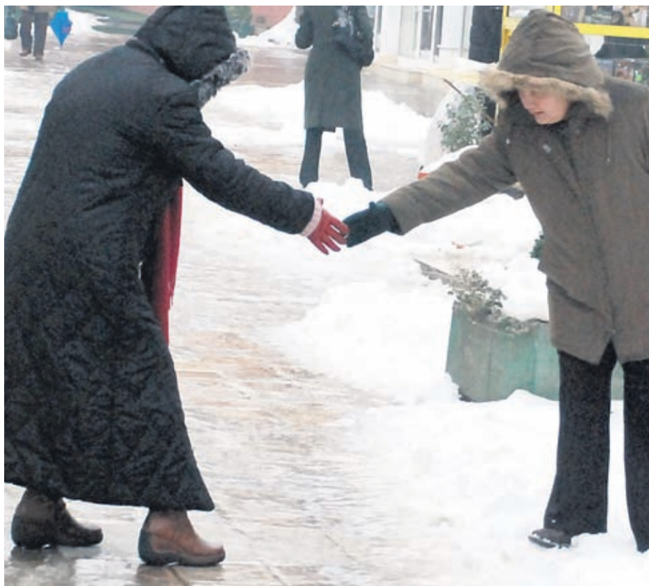
Поледиците са най-честата причина за травми през зимата

Навременната и подходяща първа помощ е от голямо значение за добрия краен резултат при лечение на счупена кост. Основен признак на счупването са болката и загубата на функция в съответната част от крайника. Често пострадалият е чул или усетил как се е счутила костта, освен това кракът или ръката са в неестествено положение, нарушават се формата и дължината в сравнение със здравия крайник. Наблюдава се оток на засегнатата зона, тя е с променен цвят, може да е нали-