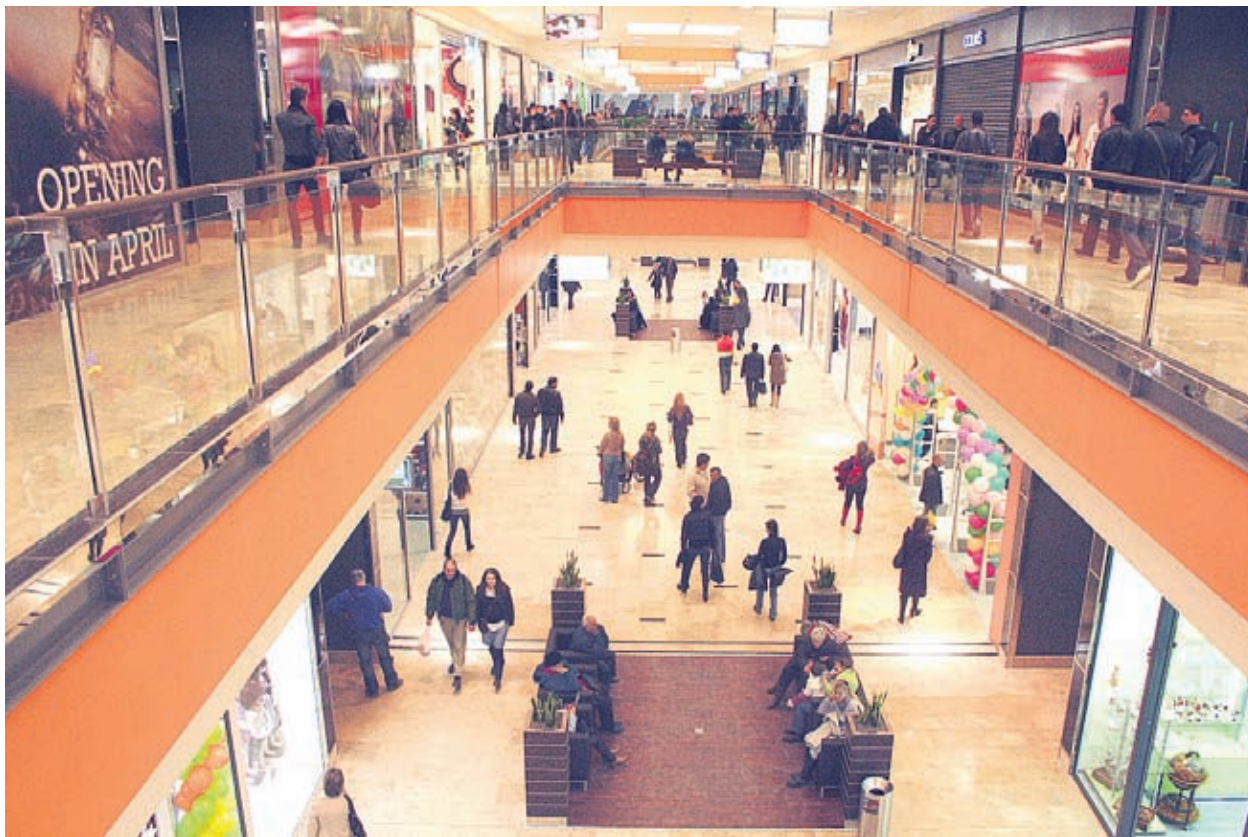
Моловете имат бъдеще най-вече като места за общуване и развлечение

Освен че е рай за купувачите, огромният търговски център е и идеално място за почивка. Под покрива на мола освен 800 магазина и над 110 заведения за хранене са събрани и няколко атракции от световна класа - най-големият закрит воден парк, разполагащ с басейн с изкуствени вълни, най-големият закрит увеселителен парк, легена пързалка, 27 кинозали, езеро с подводници, хотел, изрище за миниголф и др. Собствениците на внушителния мол са изчислили, че ще ни бъдат необходими 3 денонощия, ако искаме да обиколим всички магазини,