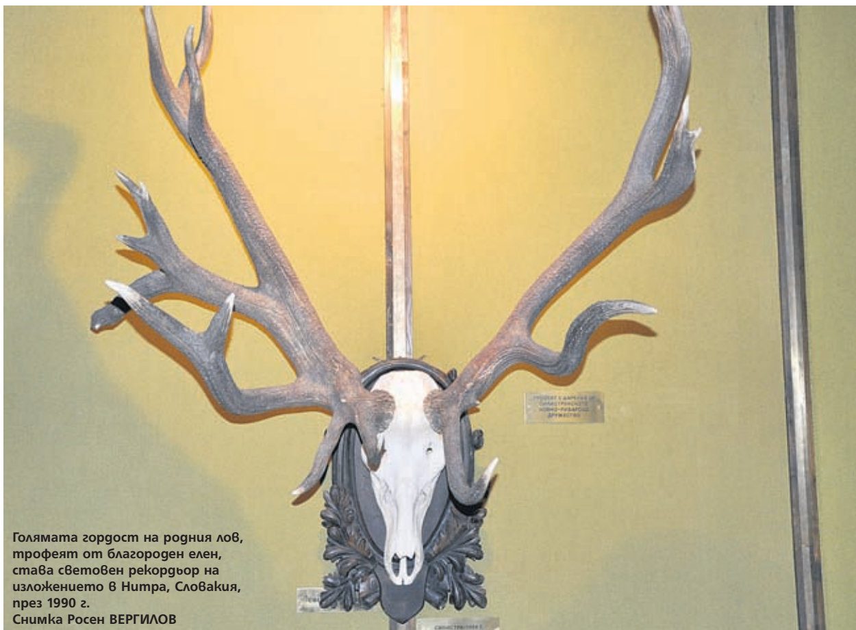
Голямата гордост на родния лов, трофеят от благороден елен, става световен рекордьор на изложението в Нитра, Словакия, през 1990 г.

● Още в края на XIX век дивечът е обявен за държавна собственост