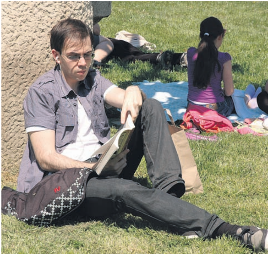
През април организмът се нуждае от подкрепа