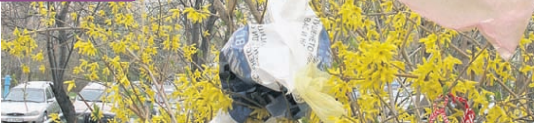
Всеки разумен българин би се отказал от удобството на найлоновото пликче в името на чистата природа

ме хартиената торбичка от времето на социализма, ните "Плод и зеленчук", а нейния доста по-голям вариант сме виждали по американските филми. Само че цената ѝ вече не е достъпна за българина. Излиза, че да си еко е модерно, но и доста скъпо. Освен това спорно е и колко си еко, щом, за да произведеш и употребиш въпросната хартиена торбичка, трябва да отсечеш дърво.