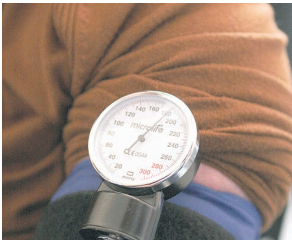
У дома е най-добре да се използват електронните апарати с маншет под мишницата

- Разбира се, че това е нормална реакция. Въпросът е с колко се покачва и от какви изходни стойности тръгва. Ако от 110/70 мм се покачи до 140/85 мм, няма риск. Това са нормални физиологични колебания. Но ако изходните стойности са например 144/90 мм, които са близки до максимално допустимите, и се покачи до 174/105 мм, това вече е хипертонична криза, която крие определени рискове. Тук от значение е скоростта, с която се покачва налягането, колко време