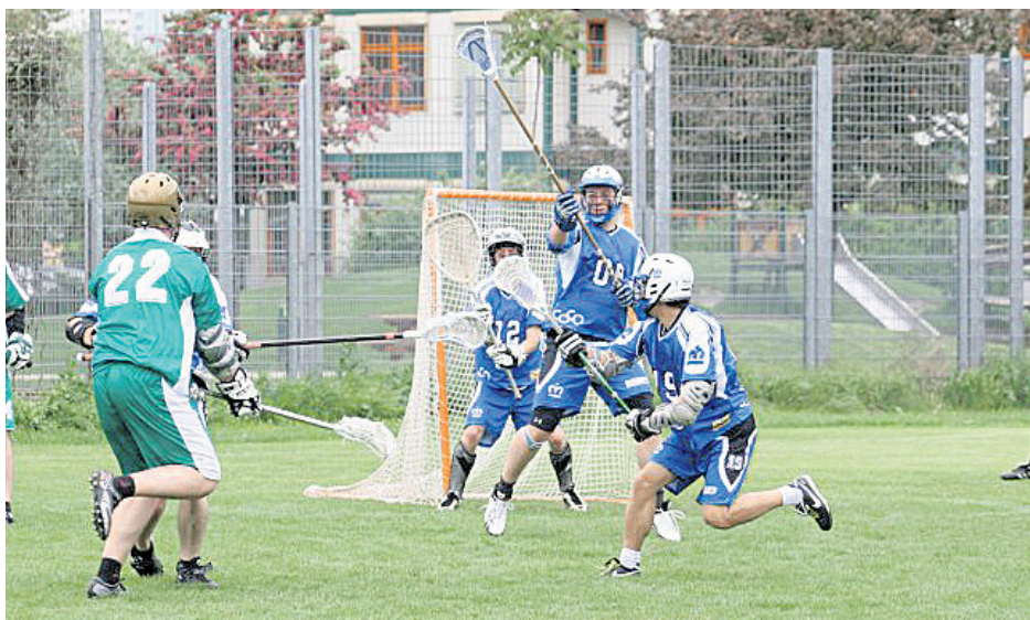
Лакрос печели все повече привърженици

● Лакрос е в България от четири години, но вече си има федерация и много фенове