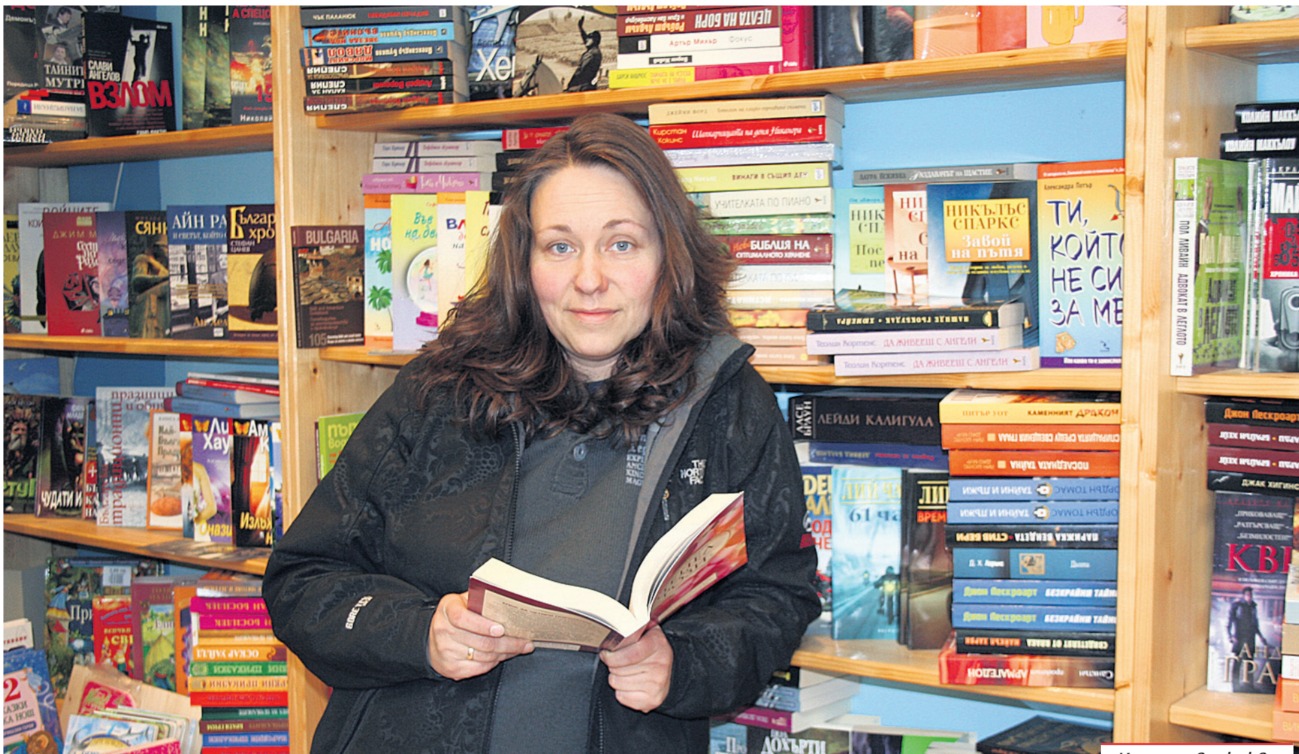
Жели е убедена, че съвременните технологии няма да погълнат шума от разлистването на страниците