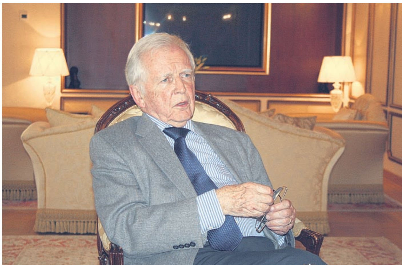
Проф. Харалд Цур Хаузен - човекът, който даде шанс на милиони жени

Бел. ред. *Меркел клетъчен карцином е рядък, но изключително агресивен вид рак, който се разпространява много бързо. Честотата му се е утроила през последните 20 години на около 1500 случая на година. По-често се среща при хора със СПИН, след трансплантации и при прием на имunosупресори.