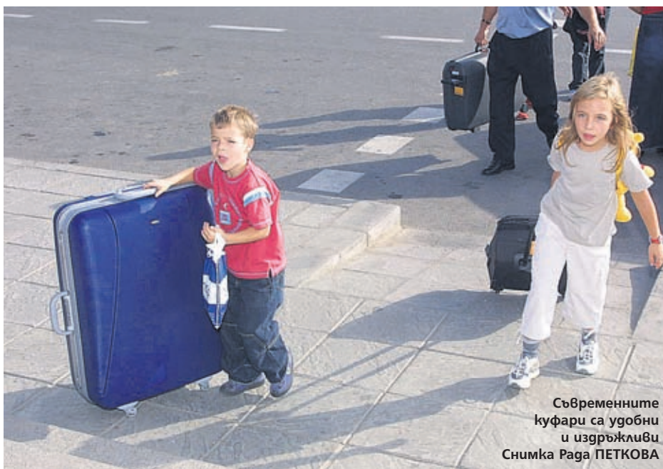
Съвременните куфари са удобни и издръжливи

Има три размера - малък, среден и голям. Малките са с размери 51/38/20 и обикновено стават за ръчен багаж в